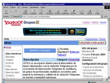
Captura de pantalla con la Página Principal de la Web del Grupo AITEA

Siguiendo con la idea de emplear las NNTT para el intercambio y difusión de información de temas relacionados con la Atención Temprana, la Asociación de Intervención Temprana de Andalucía, AITEA, ha fundado el pasado día 9 un grupo con igual nombre: Grupo AITEA, albergado en el servidor "Yahoo!", dentro de la categoría Formación y Educación/Preescolar.