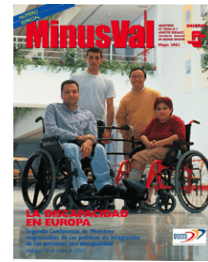
La Discapacidad en Europa Minusval. Número Especial. Mayo 2003