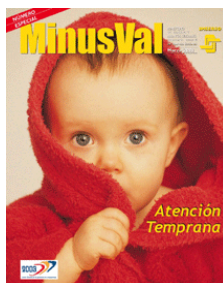
Atención Temprana Minusval. Número Especial. Marzo 2003