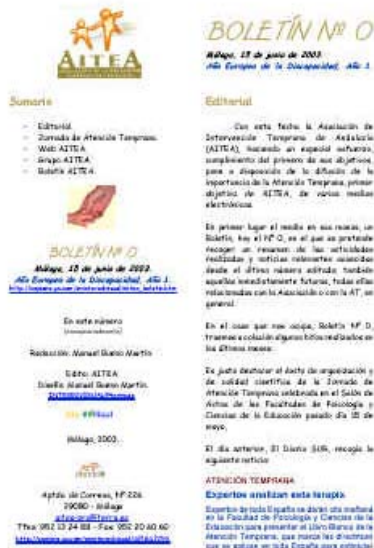
Captura de pantalla con Boletín AITEA, Nº 0, de 15 de junio de 2003 Página 1

También llegará mediante correo electrónico a los miembros suscritos al Grupo AITEA, y a los internautas que lleguen a la Web AITEA en navegación fortuita o intencionada.