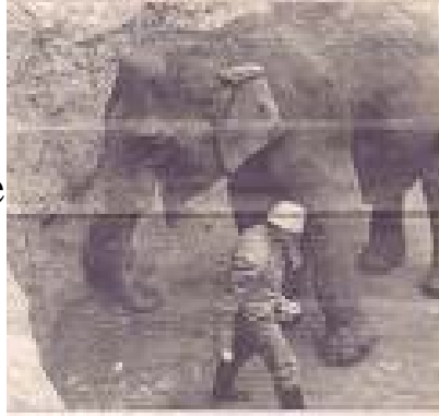
SALINAS DE CABO DE GATA

Ayer tarde se encontró un elefante por la zona de Cabo de Gata.