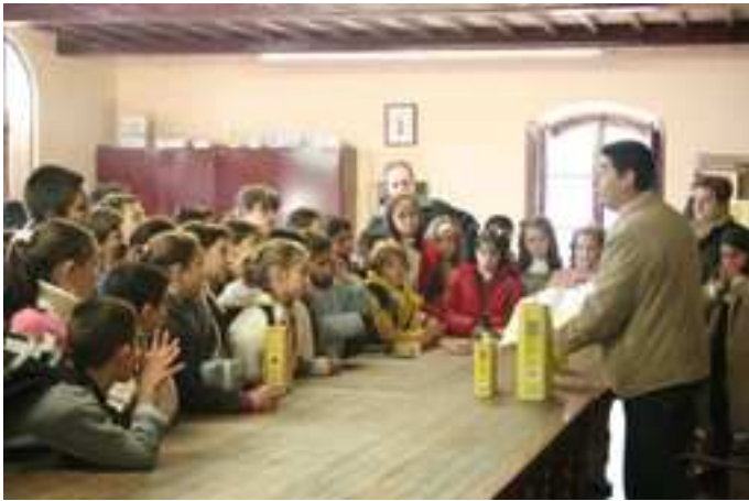
En Baena, aprendiendo cómo se fabrica el aceite