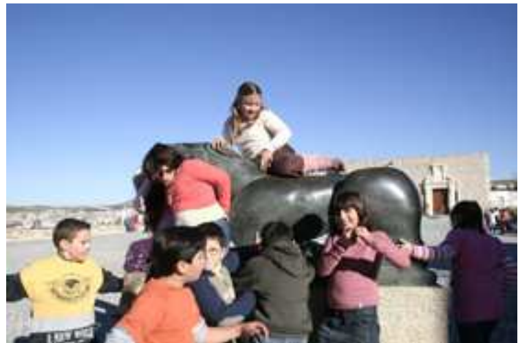
Jugando con el león ibérico