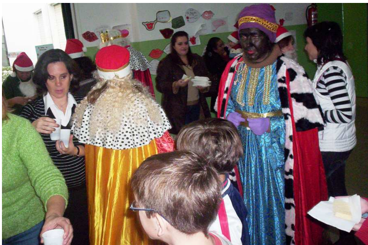
Los Reyes Magos visitaron las clases y repartieron caramelos