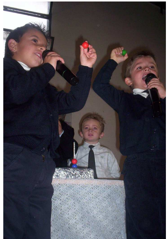
Cantando el "gordo" en la fiesta de infantil