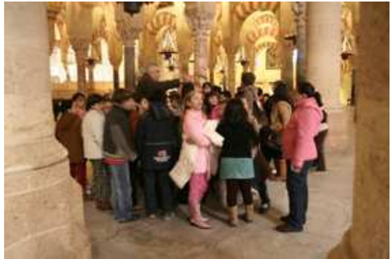
En la Mezquita-Catedral conociendo arte e historia