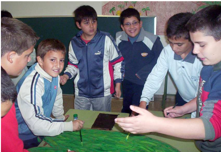
Preparando la fiesta de Navidad