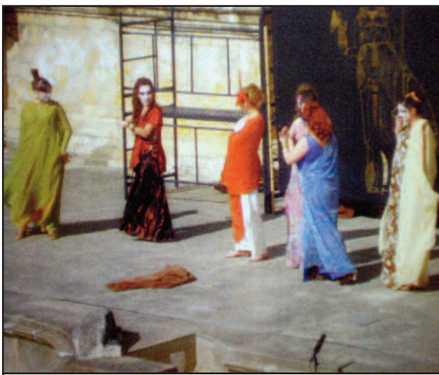
Los estudiantes disfrutaron de la comedia teatral.