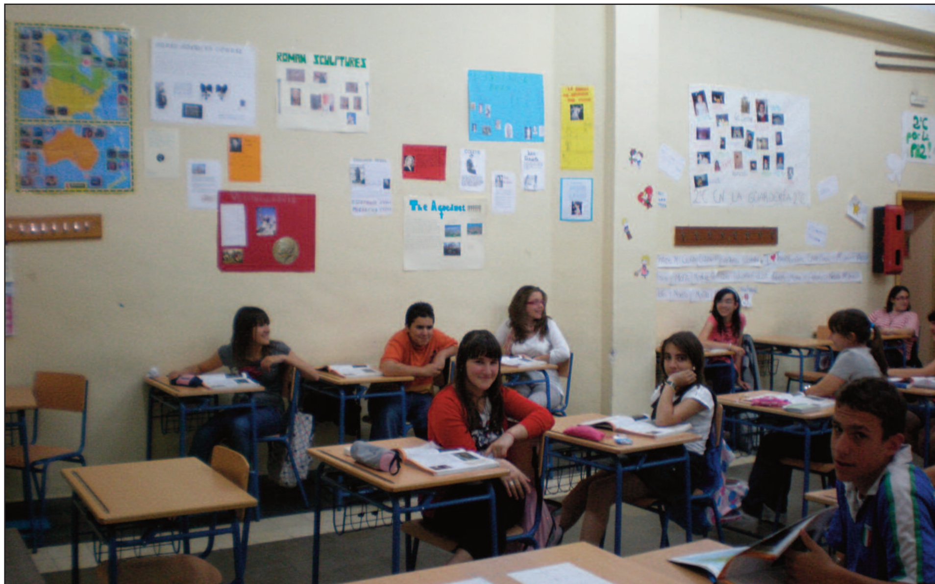
Durante este curso, los grupos que han obtenido mayor puntuación en el certamen han sido los de 2º y 3º de ESO "C". ¡Enhorabuena!

Como ya viene siendo habitual, el I.E.S. "Manuel Reina" organiza cada curso un certamen llamado POR UN CENTRO MÁS LIMPIO dirigido a los alumnos con el fin de mantener entre todos nuestro instituto en unas buenas condiciones de higiene y limpieza, independientemente de los realizados por los servicios destinados a ese menester. Para ello, se incentiva con un viaje a Isla Mágica al final del curso a aquellos/s