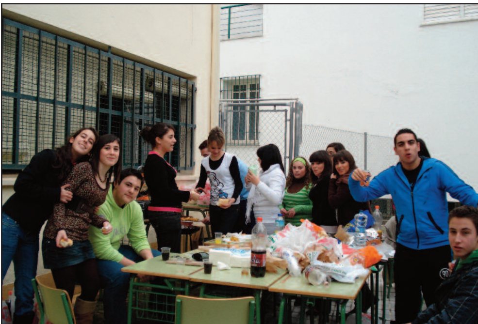
Tras las actividades, los alumnos y profesores celebraron Santo Tomás con un familiar almuerzo.