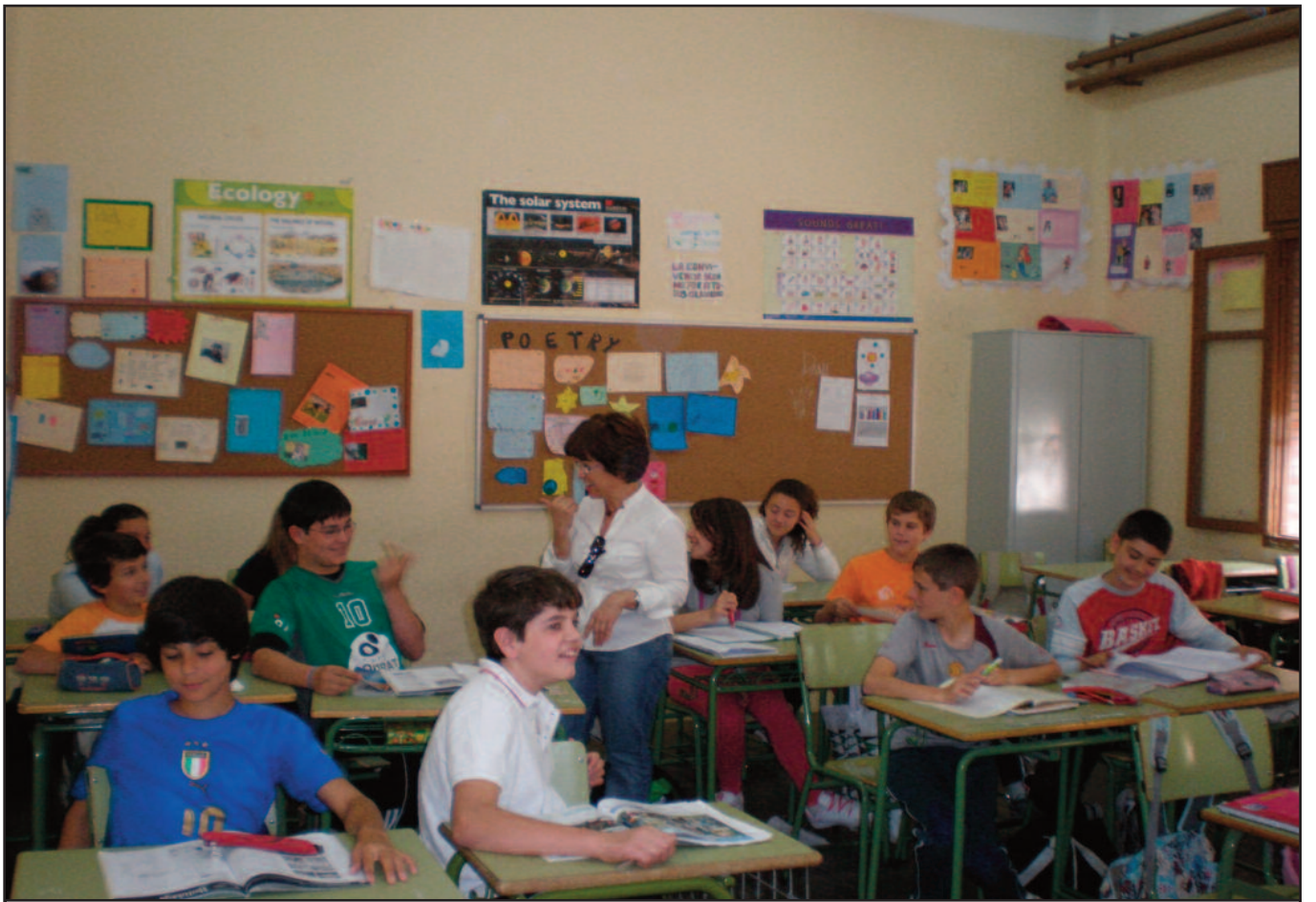
Durante el desarrollo de sus clases, los estudiantes participan, indistintamente, en español o lengua extranjera.

Porque no podemos olvidar el principal objetivo