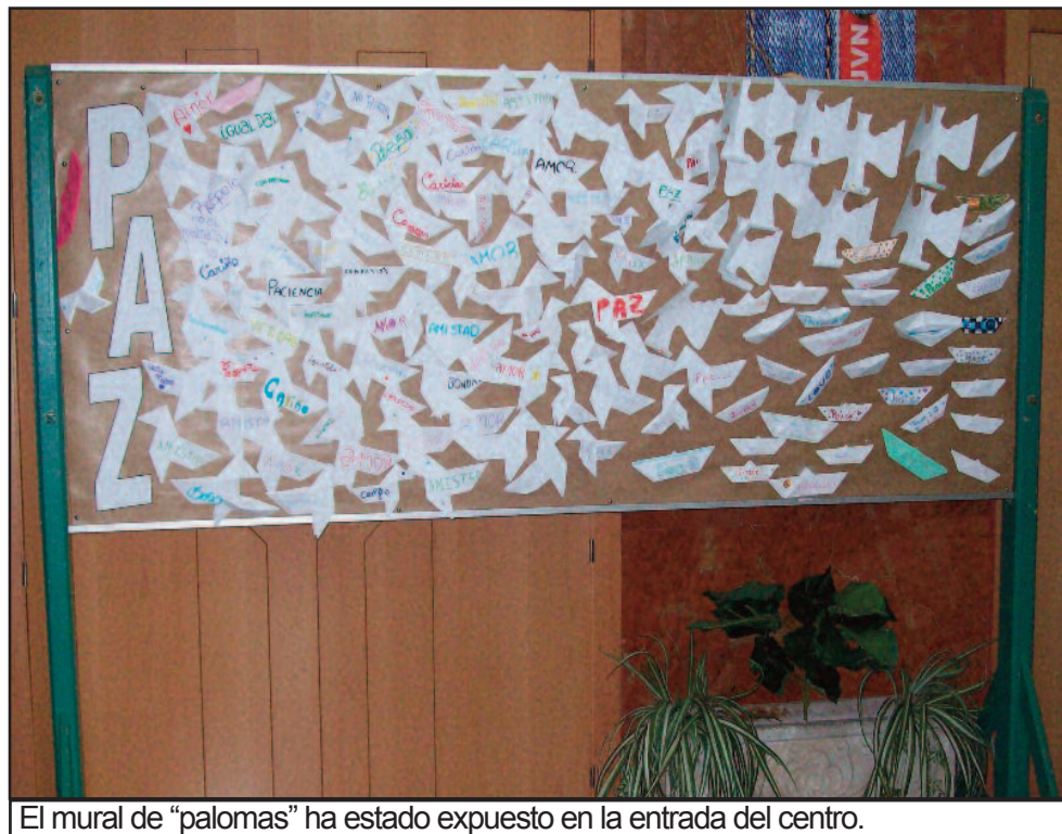
El mural de "palomas" ha estado expuesto en la entrada del centro.

De lo anterior, se deduce que ambos Proyectos Educativos se fundamentan en los mismos aspectos: la tolerancia, el respeto y la igualdad. Por ello, las profesoras y profesores que formamos parte de estos proyectos estamos trabajando de forma conjunta.