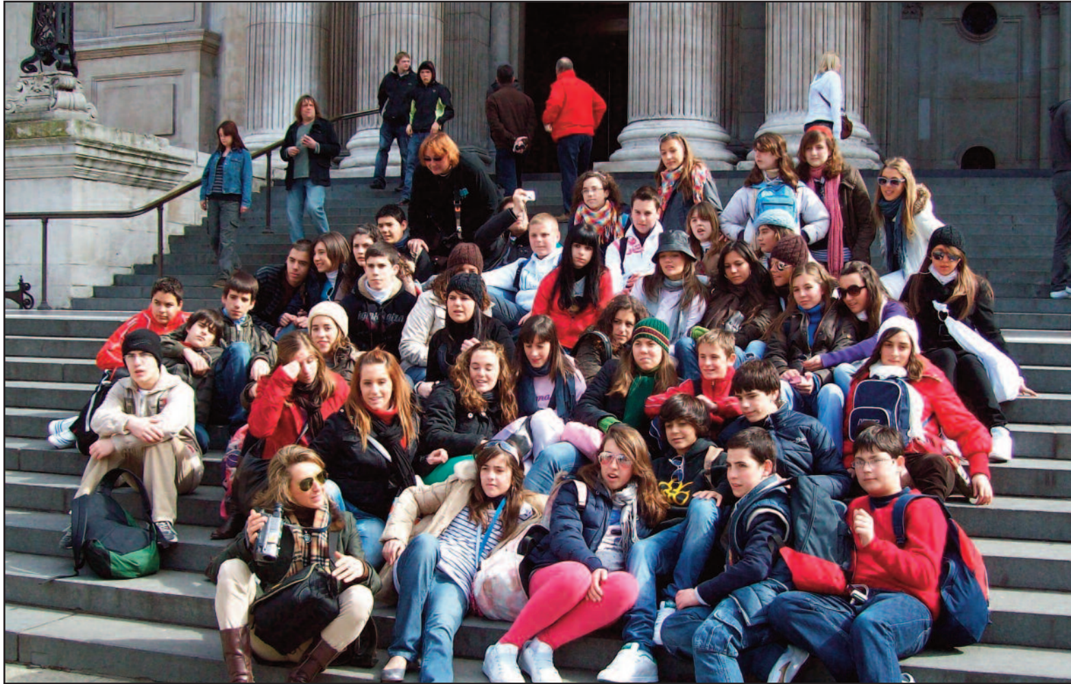
La experiencia londinense sirvió también a los estudiantes para aprender a moverse con el metro por una gran ciudad.