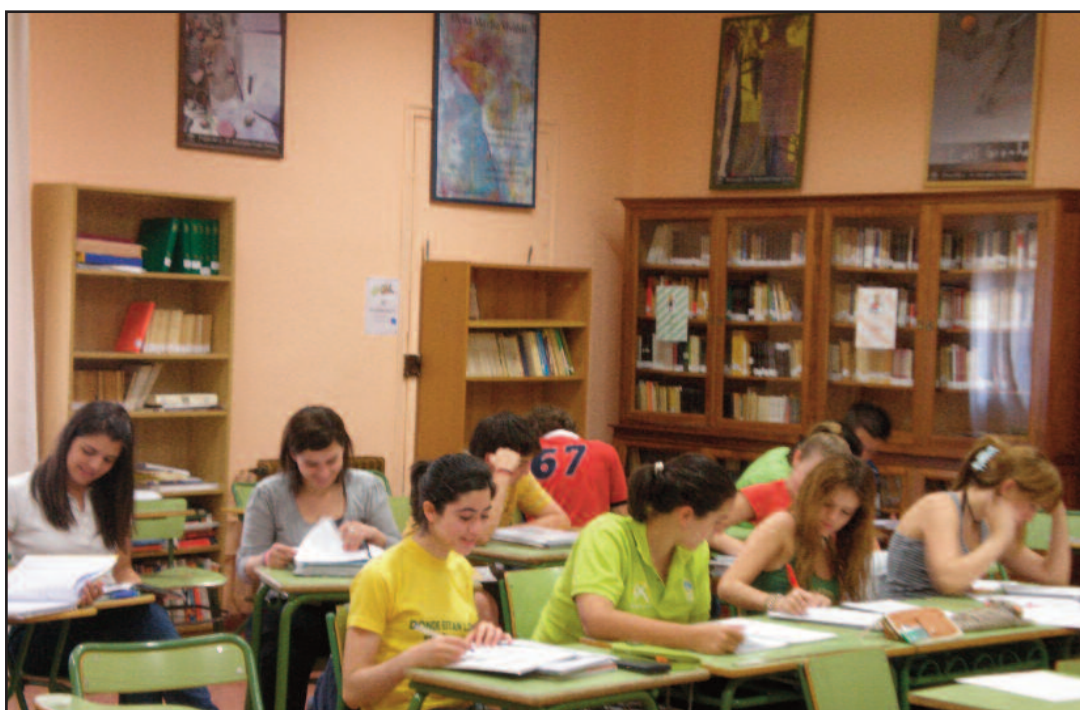
Durante este curso, la Biblioteca ha estado abierta por la tarde diariamente.

Desde el curso 07-08, existe un compromiso por parte de todos los profesores para convertir la biblioteca en dinamizadora de la vida escolar y para crear un hábito lector entre nuestros alumnos y alum-