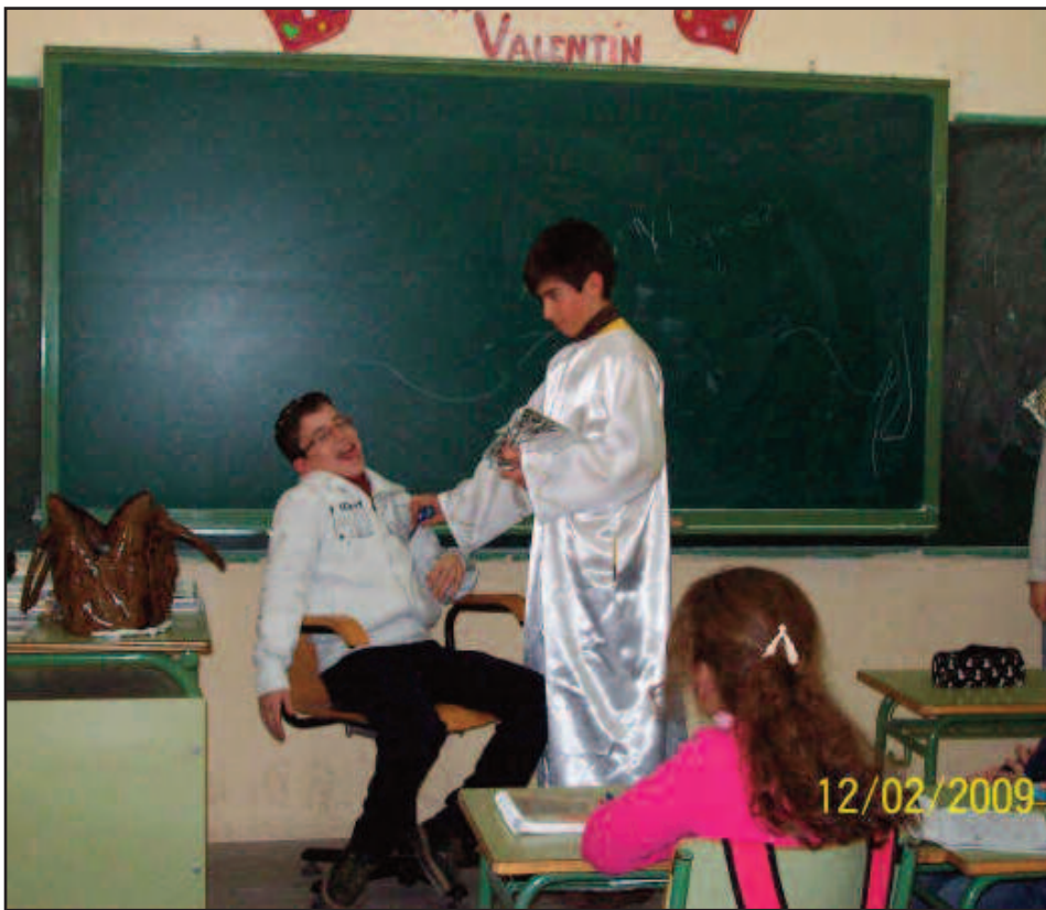
Alumnos de 1º de ESO representaron los mitos en sus aulas.

Durante algunas semanas los trabajos en inglés,