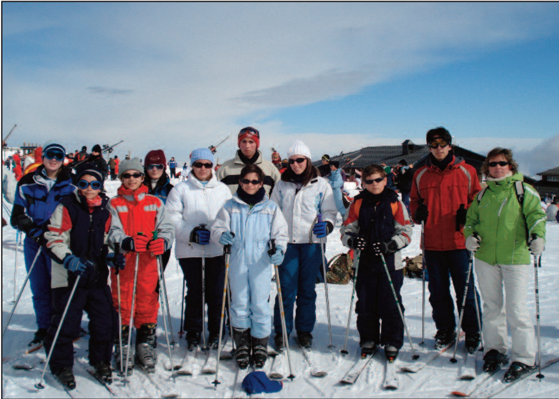
Los jóvenes y no tan jóvenes disfrutaron de una climatología perfecta para la práctica del esquí.

Al día siguiente nos despertamos temprano para ir a desayunar y subir a Borreguiles para comenzar la actividad de esquí. El primer día nos costó trabajo aprender durante las tres horas, aproximadamente, de clase impartidas