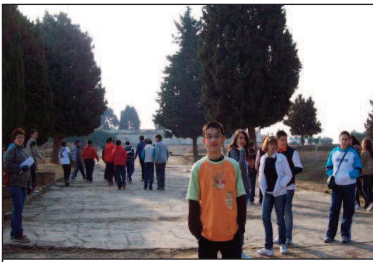
La excursión a Itálica se realizó el 20 de febrero.

Como actividad final del proyecto se realizó una visita a las ruinas romanas de Itálica (Santiponce, Sevilla) y un paseo en barco por el río Guadalquivir, el antiguo Betis romano.