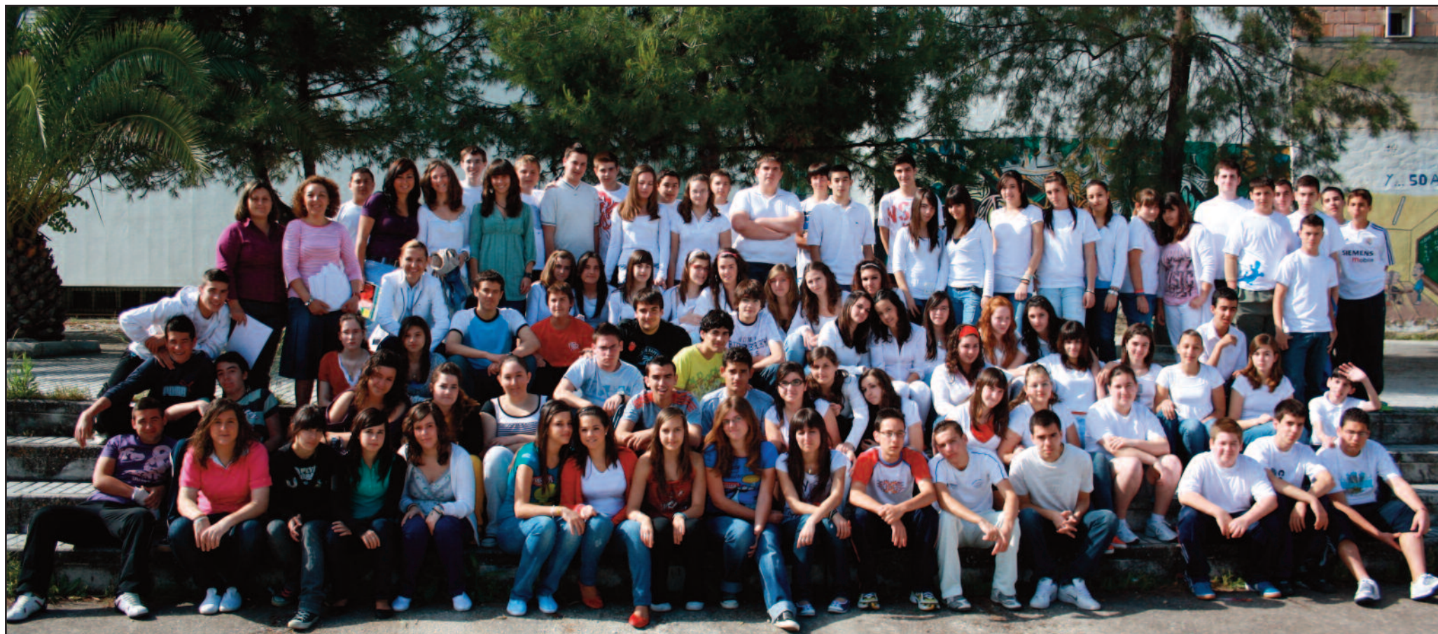
Alumnos de 3º formaron una paloma "viviente" para participar en el vídeo del Proyecto "paZalo.es"