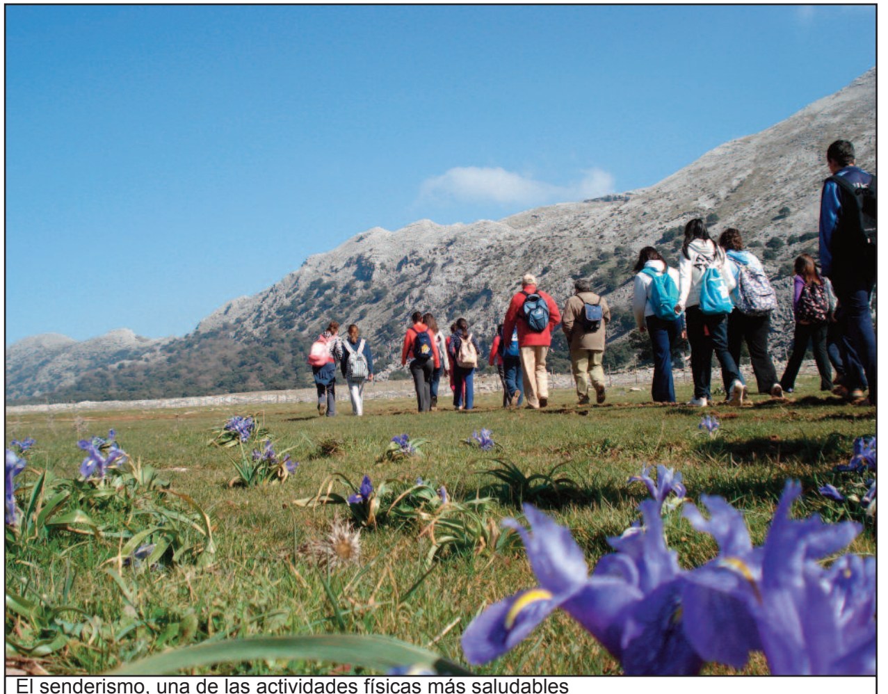
El senderismo, una de las actividades físicas más saludables

rendimiento deportivo, debemos someter al individuo a esfuerzos progresivamente crecientes en intensidad, volumen y complejidad. De esta forma no sólo se favorecerá la adaptación del organismo al esfuerzo, sino el aumento de los umbrales mínimos y máximo de tolerancia.