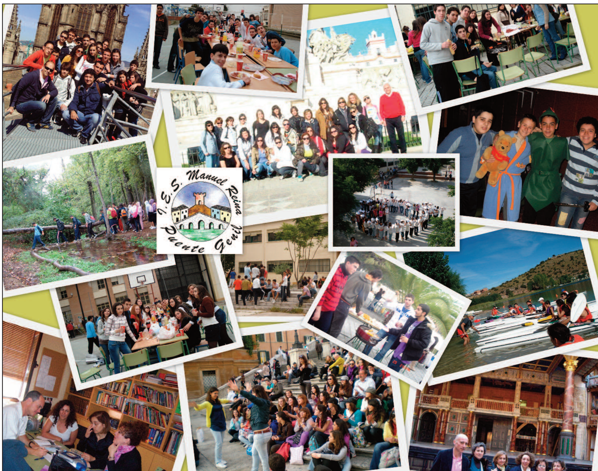
El curso académico ha sido largo e intenso, pero al final, siempre quedan en el recuerdo los mejores momentos.