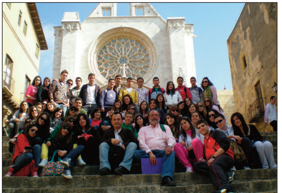
En su camino a Italia, el grupo tuvo tiempo para visitar la ciudad de Tarragona.

disfrutamos en esos maravillosos días, que no habrían sido posibles sin el acompañamiento de nuestros profesores.