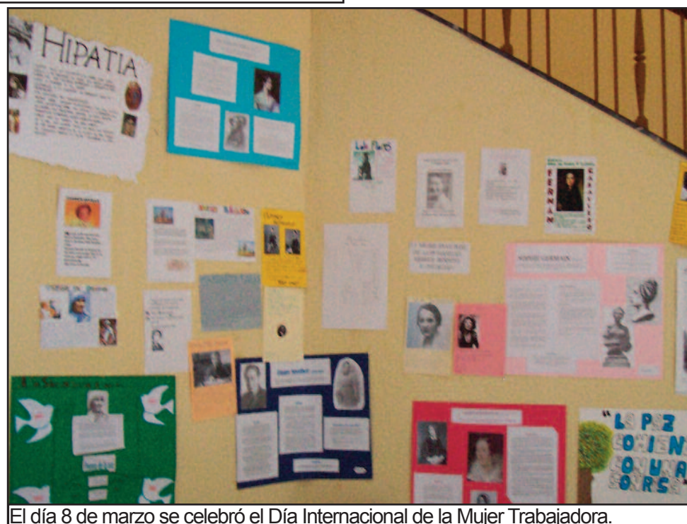
El día 8 de marzo se celebró el Día Internacional de la Mujer Trabajadora.