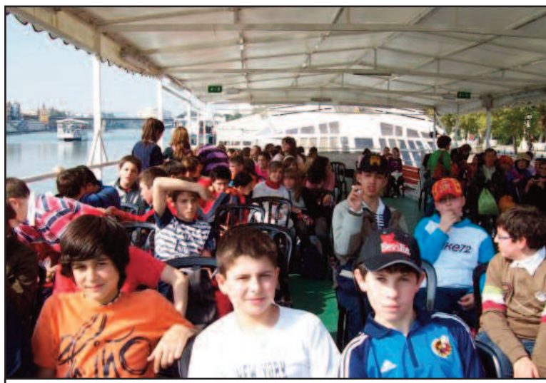
Los alumnos cogieron el barco en la famosa Torre del Oro.