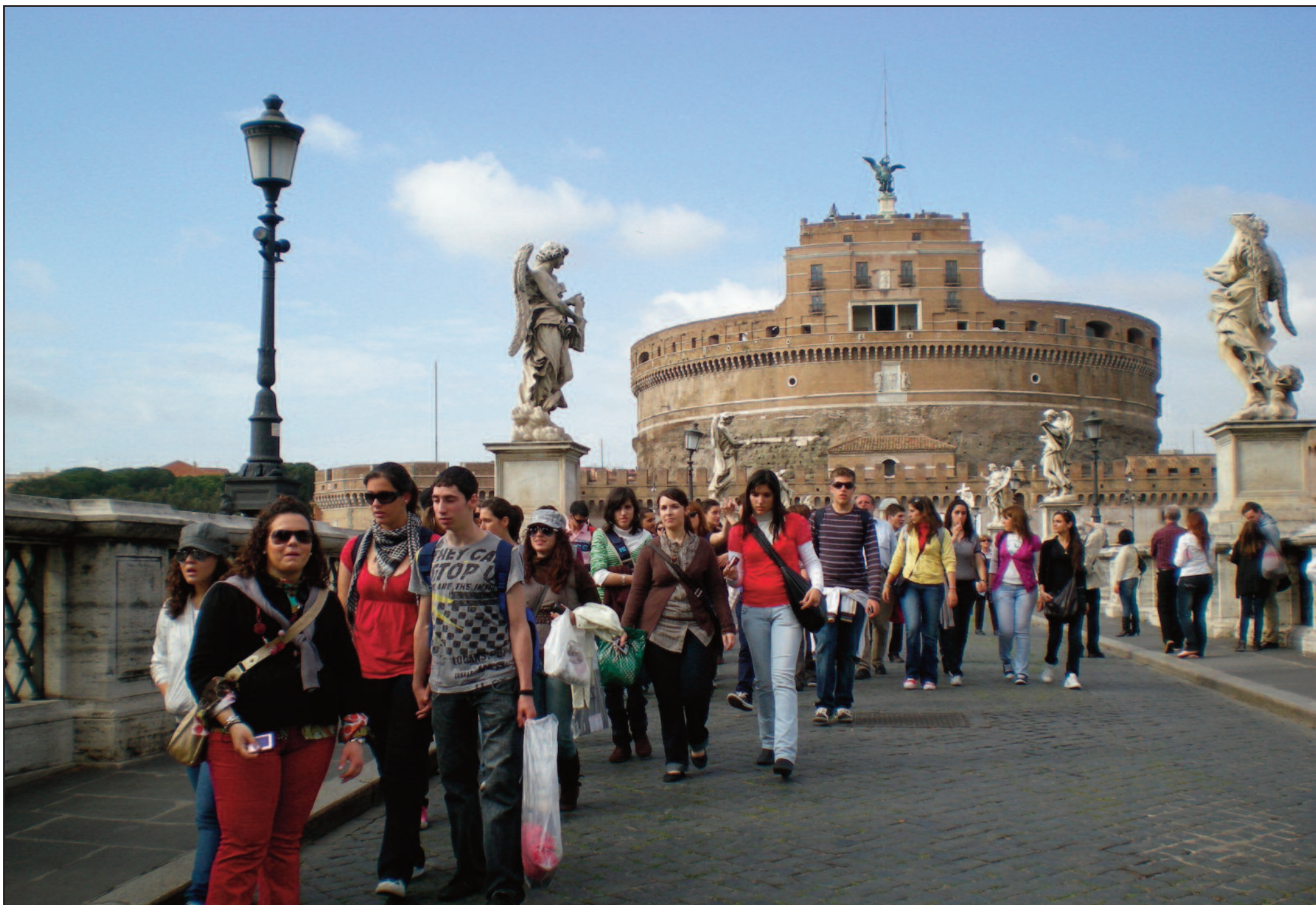
Tras la visita del Castillo de San Angelo, los alumnos de 2º de Bachillerato continuaron su ruta por la ciudad de Roma.