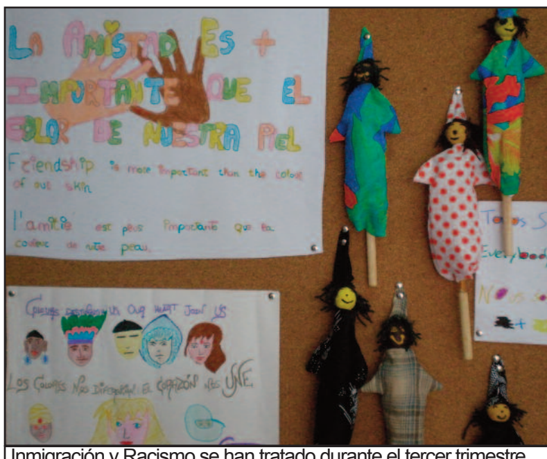
Inmigración y Racismo se han tratado durante el tercer trimestre.

van de estímulo para continuar aprendiendo y participan activamente en las distintas actividades que se organizan en el Centro. Durante este curso podemos resaltar que los alumnos que asisten al Aula de Apoyo han participado activamente en las actividades desarrolladas por varios de los proyectos que se llevan a cabo en el Centro, como el Proyecto Interdisciplinar "La Roma antigua", Plan Escuela espacio de paz o Plan de igualdad entre hombres y mujeres.