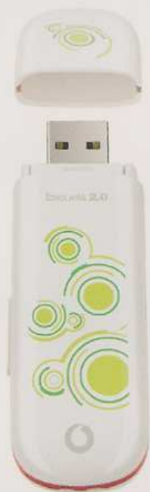
Módem USB Stick HSDPA K3565 Especial Kids

En Vodafone queremos que tu hijo pueda adaptarse a las necesidades actuales del Sistema Educativo, en las que los formatos digitales y el componente Online son cada vez más importantes. Por eso hemos creado esta tarifa ' Internet Contigo Deberes ' exclusivamente pensada para tus hijos y para ti.