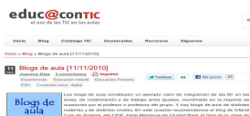
"Blogs de aula" Juanma Díaz