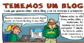
Tenemos un blog

Algunos ejemplos de uso didáctico de los blogs: