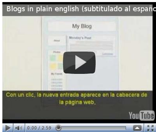
Blogs , explicado de forma sencilla (Subtitulado)