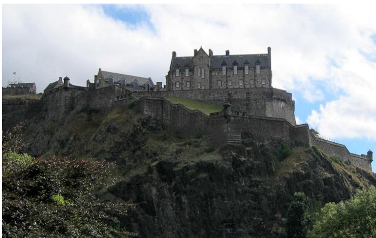
Castillo de Edimburgo sobre Castle Rock. Publicado bajo la licencia CC BY-SA 3.0 via Wikimedia Commons