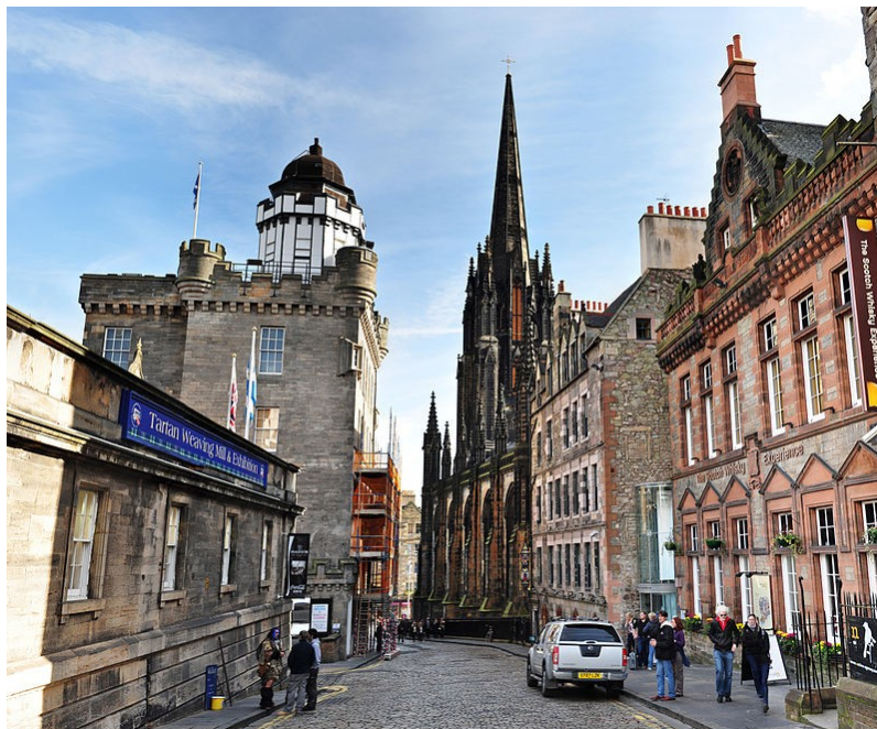
Royal Mile

Se realizarán actividades previas al viaje para conocer el país, como un concurso semanal a través del correo electrónico para conocer la historia, geografía, arte y ciencia del lugar a visitar.