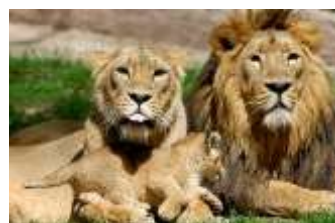
Gato selvático (Felis chaus) Civeta (Felis nigripes) León y leona (Panthera leo) En primer, segundo y tercer lugar.