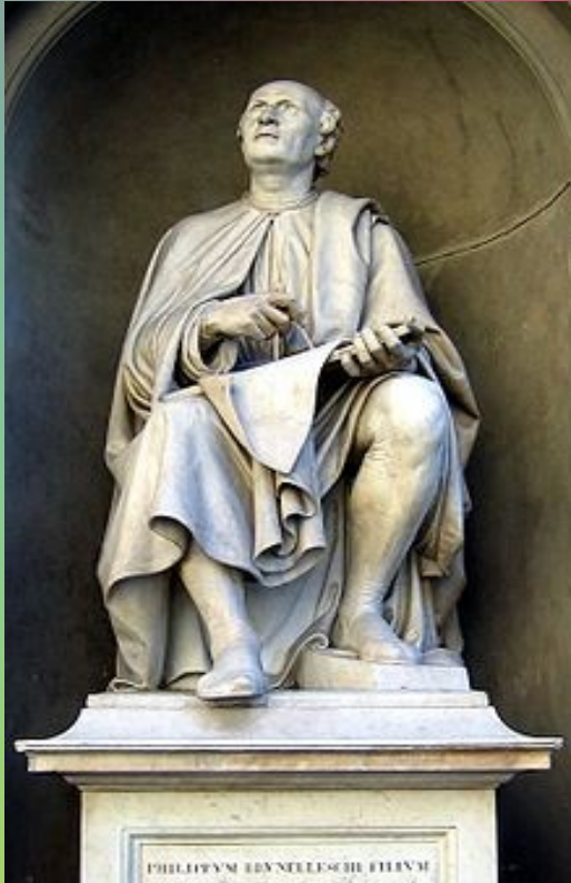
Escultura de Brunelleschi mirando Il Duomo de Florencia.

Filippo di Ser Brunellesco Lapi, conocido simplemente como Filippo Brunelleschi, fue un arquitecto, escultor y orfebre renacentista italiano.