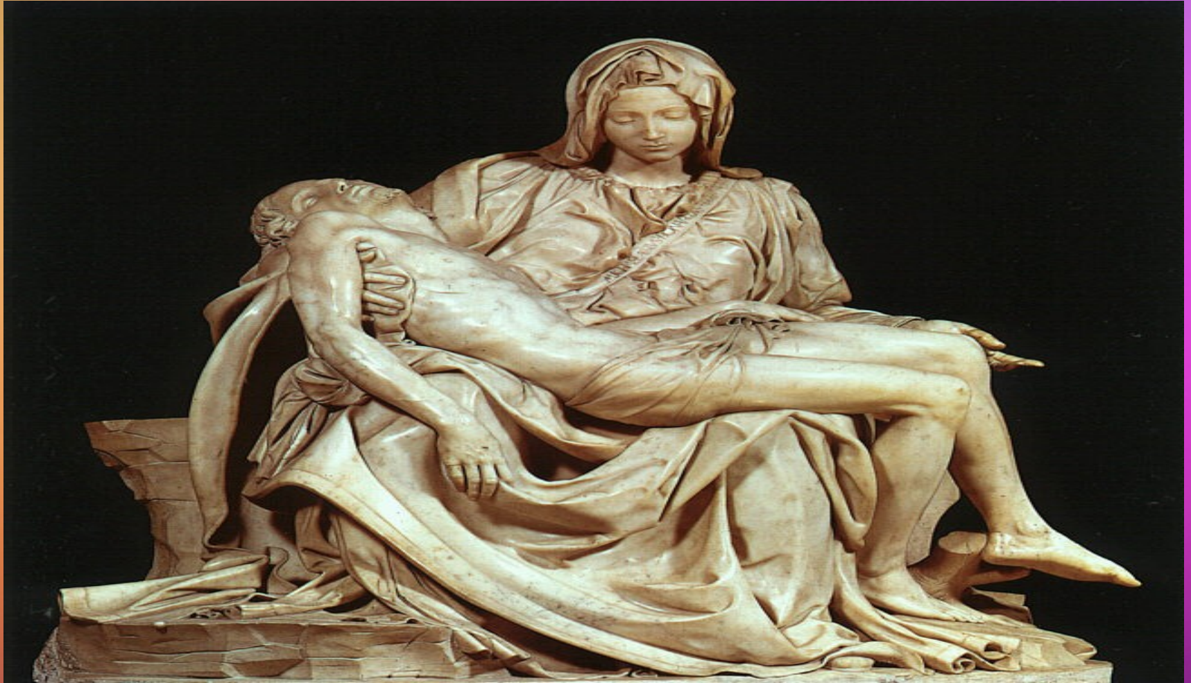
MIGUEL ANGEL BUONARROTI: LA PIEDAD