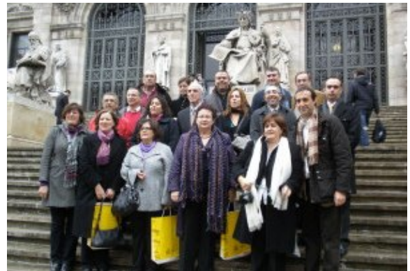
Centros andaluces premiados