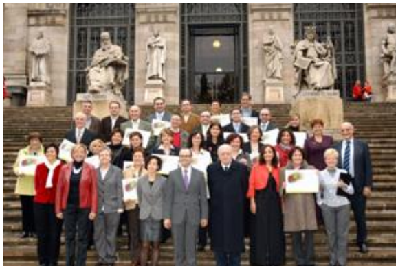
Todos los centros premiados.