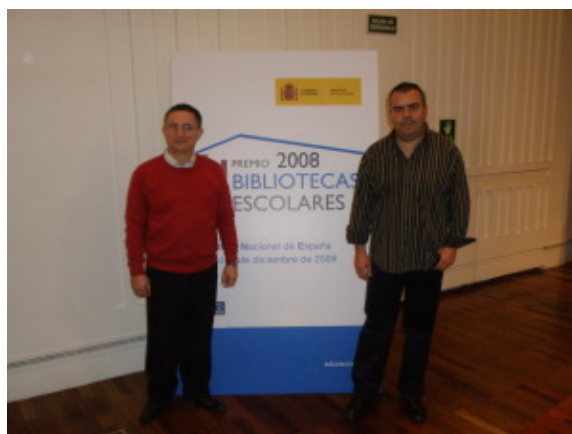
Director y jefe de estudios.