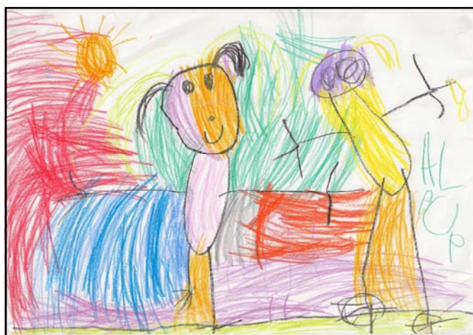
Paula. 4 años B