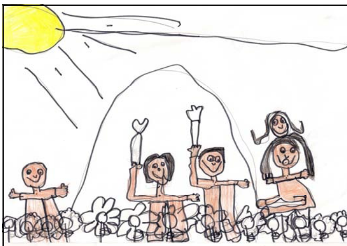
Alejandra Oses. 5 años B