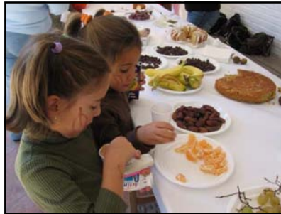
Probando los frutos del otoño

dos probaban sabores nuevos: batata, caña de azúcar..., otros se decantaban por lo tradicional: castañas, bizcochos, nueces..., pero todos se lo pasaron genial celebrando la llegada del otoño.