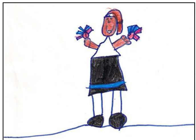
Lucía. 5 años A