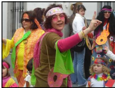
Un momento durante el Pasacalles

calles de Tarifa arropados por el calor de las familias y deslumbrados por los flashes de las miles de cámaras de fotos que trataban de inmortalizar este precioso día. Este año tuvimos la colaboración de un montón de mamás y papás que se animaron a disfrazarse con nosotros y nos ayudaron con los peques, lo que otorgó, aún si cabe, más colorido a este Pasacalles infantil que cada año que pasa está logrando una mayor acogida entre todo el pueblo de Tarifa.