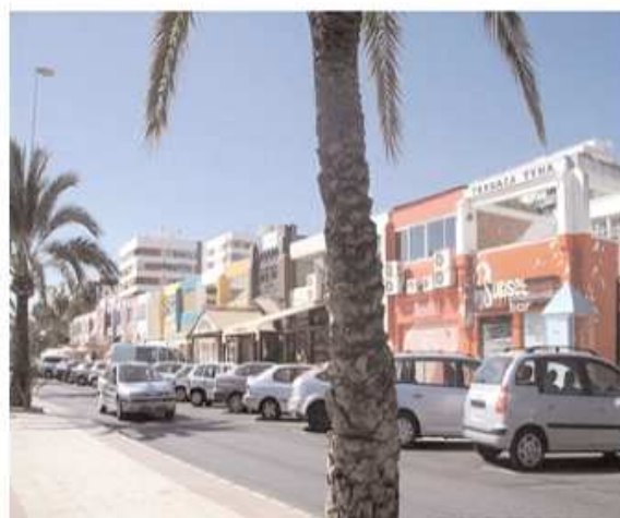
Zona de ocio de Torre del Mar