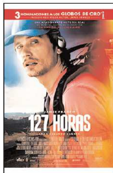
Cartel de la película 127 horas

¿Hasta dónde estarías dispuesto a llegar para sobrevivir?