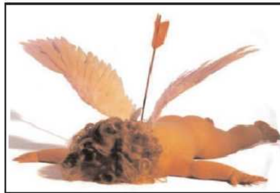
El amor siempre acierta con sus flechas

que alguien piense que la noticia es una mera burla, el estudio del enamoramiento es muy serio: Todos, sin excepción, tardamos más o menos 0,5 segundos en enamorarnos.