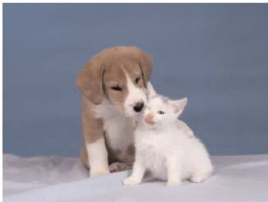
La amistad no entiende de diferencias, sino de cariño