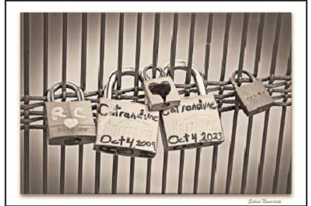
Los candados de los enamorados sobre el río Tíber son otra tradición en San Valentín

Los enamorados tienen un día en nuestro calendario para demostrar o reafirmar su amor mediante regalos, dedicatorias o poemas pero ¿por qué el 14 de febrero? ¿Quieres conocer la leyenda de San Valentín y de dónde procede esta celebración?