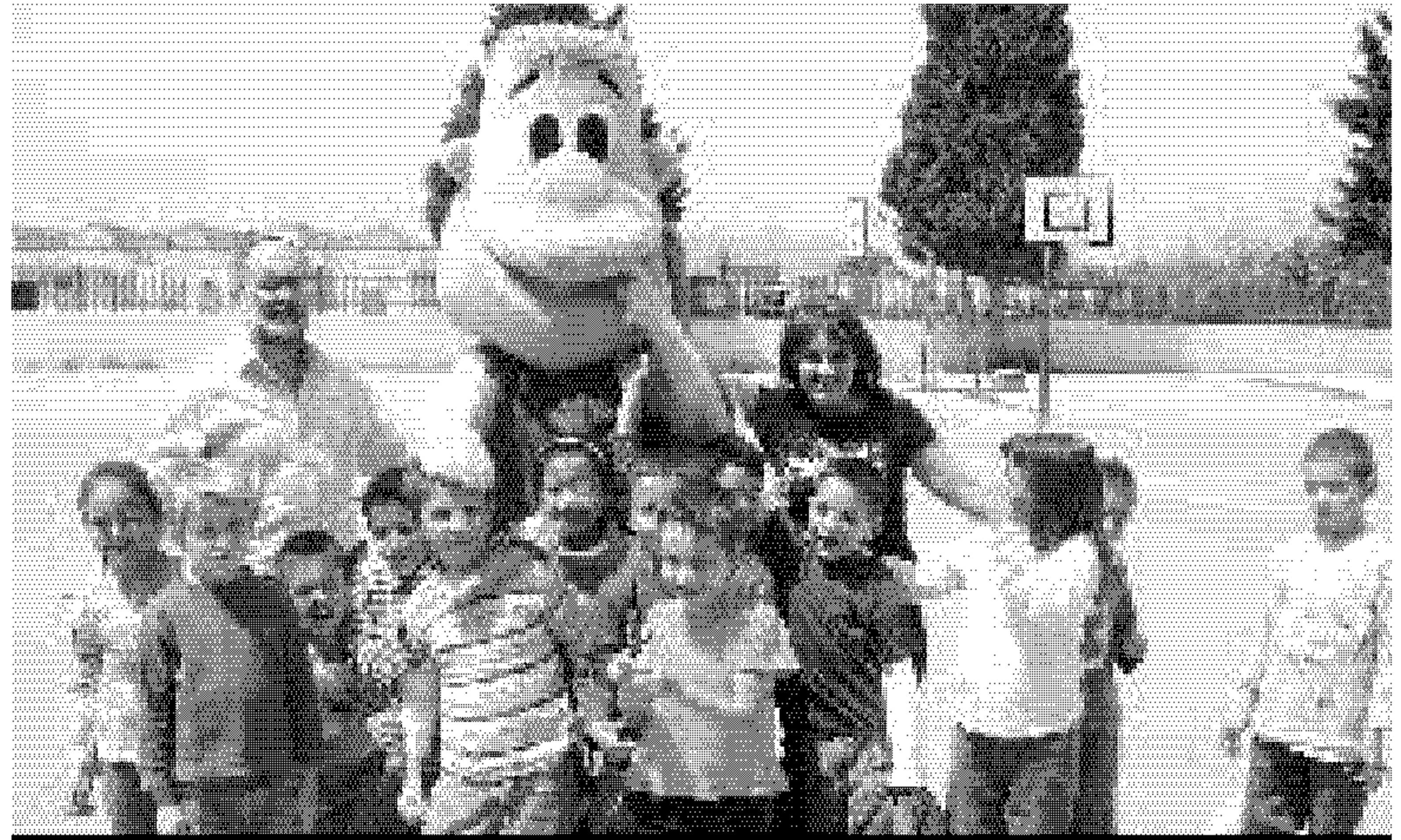
VISITA. Chicui, junto a los alumnos del CEIP Intelhorce. / SUR

La campaña del Unicaja, 'El deporte es vida' visitó ayer el colegio Intelhorce y hasta allí se desplazó la mascota del Unicaja, Chicui, que explicó por medio de la mímica a todos los niños presentes los mensajes que la campaña quiere promover entre los más pequeños: hacer deporte, llevar una vida sana, estudiar mucho y relacionarse con los demás. / SUR