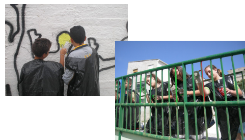
Actividades de intervención en el centro