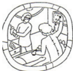
Art. 43: Se reconoce El derecho a la protección de la _____