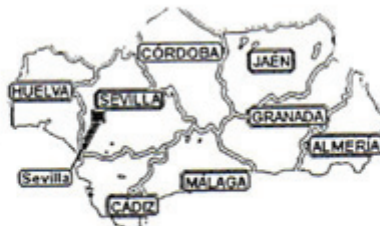
Art 137: El Estado se organiza territorialmente en municipios, provincias y _____