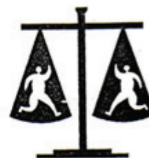
Art. 14: Se reconoce la _____ ante la ley