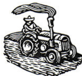
Art. 35: Todos los españoles tienen derecho al _____