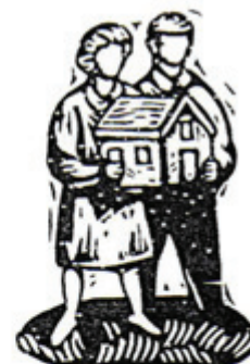
Art. 47: Todos los españoles tienen derecho a disfrutar de una _____ digna