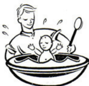
Art. 15: Todos tienen Derecho a la _____