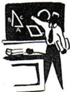
Art. 27: Todos tienen Derecho a la _____

Nos gustaría saber si la conocéis. Os proponemos un juego: buscad en esta sopa de letras la idea fundamental de algunos artículos. ¿Os atrevéis?