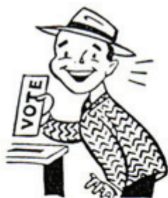
Art. 23: Los ciudadanos Tienen el derecho a _____