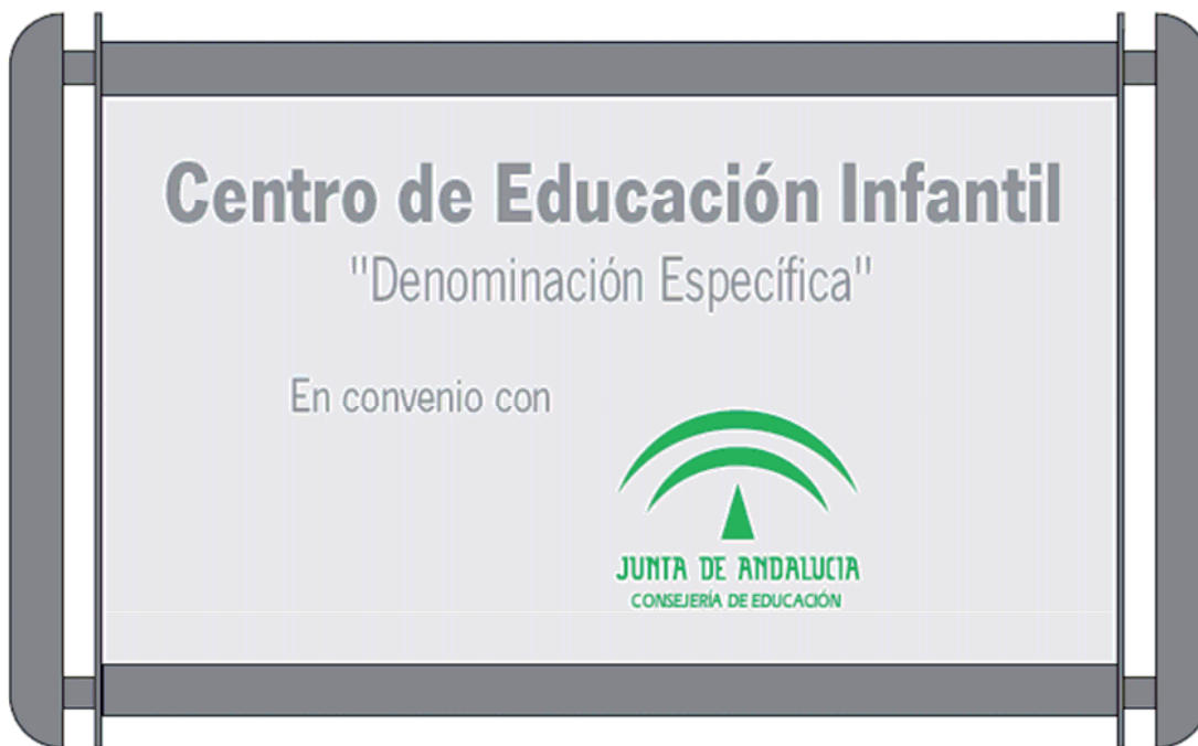
PLACA A PARED SP