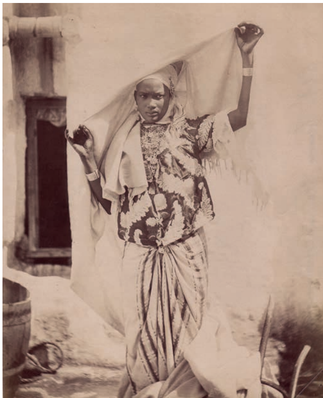
Mujer tunecina con vestido tradicional (1885-1900).