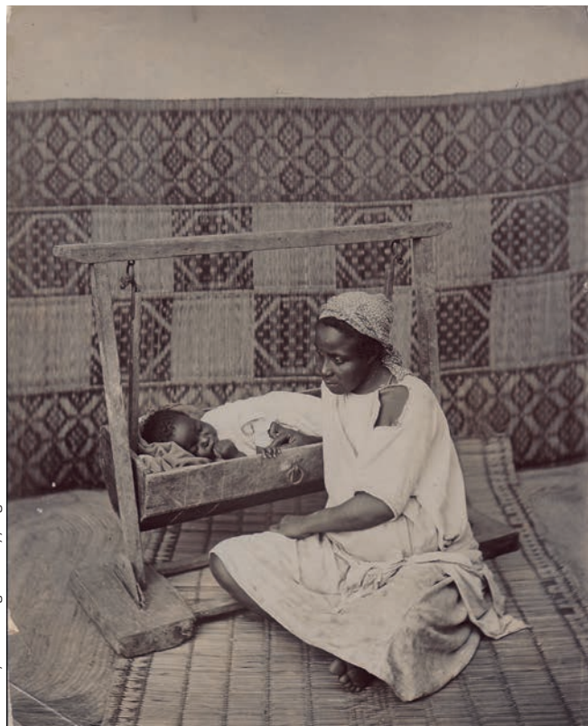
Mujer africana con su hijo en una cuna de madera (1885-1900). Tánger, Protectorado Español de Marruecos.

para numerosos eruditos, cuyos conocimientos y experiencias fueron plasmados en los nuevos adelantos técnicos que alumbraba el nuevo siglo. Fue el caso de la fotografía. Numerosas fotografías procedentes de las entonces colonias africanas empezaron a circular en ambitos intelectuales de Europa mostrando monumentos antiguos, ritos y danzas ancestrales o paisajes característicos.