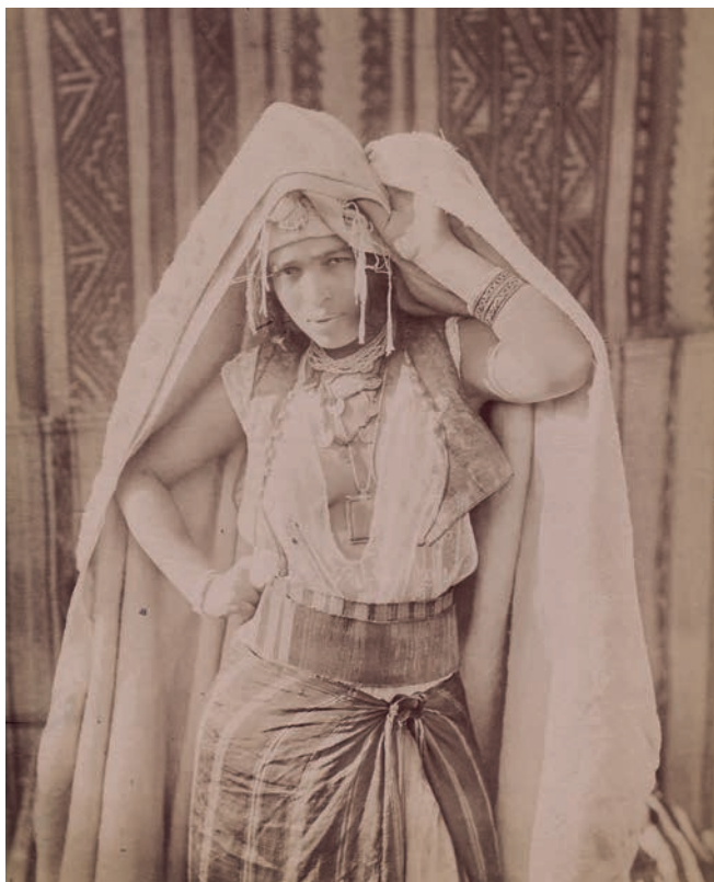
Mujer argelina cubierta con un haïck (1885-1900).