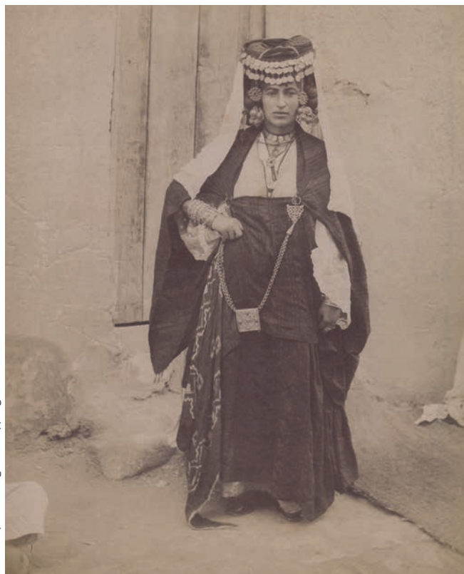
Niña argelina con traje tradicional (1885-1900). Biskra, Argelia.