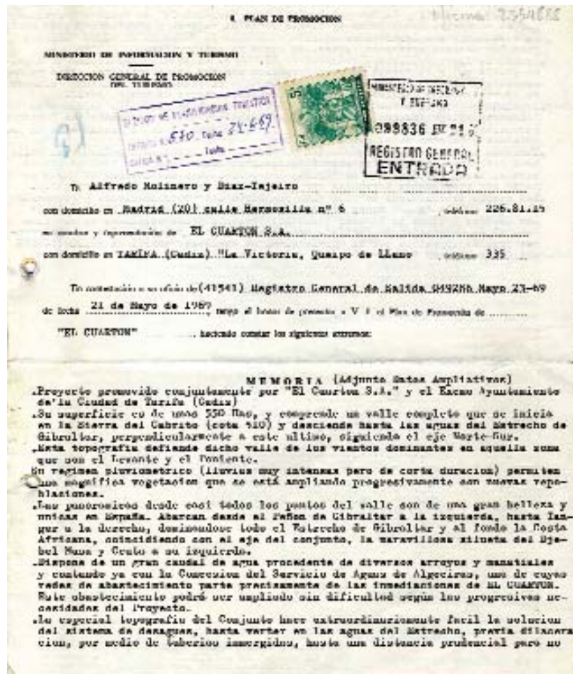
Plan de Promoción Turística de El Cuartón en Tarifa (Cádiz).

ellos conocemos los problemas y vicisitudes que vivieron.