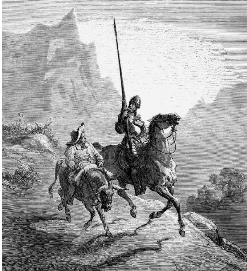
Don Quijote y Sancho Panza, en una de las famosas ilustraciones de Gustav Doré.

Otro campo vinculado con el ambiente caballeresco en que vemos ejercitarse y señalarse a Gutierre de Quijada es en el de las justas y torneos. Existían diferencias entre estos dos tipos de prácticas: las justas eran enfrentamientos individuales entre dos contrincantes, mientras que en los torneos se enfrentaban dos grupos o bandos de caballeros simulando el choque de dos ejércitos en una batalla. Estos ejercicios caballerescos constituían para los caballeros una forma de mantenerse en forma en tiempos de paz, una suerte de deportes bélicos, en los que realizaban simulacros de combates singulares y de batallas. La participación en justas y torneos era, además, una forma de propagar la fama y honor del caballero y, por extensión,