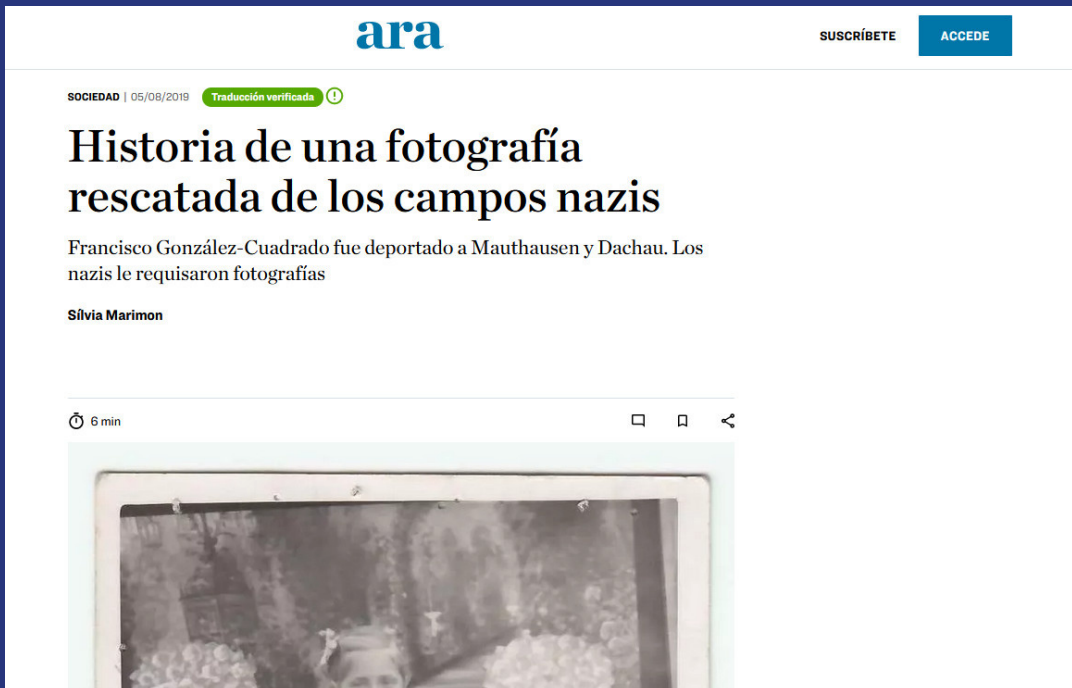
Historia de una fotografía rescatada de los campos nazis - Ara 5 agosto 2019