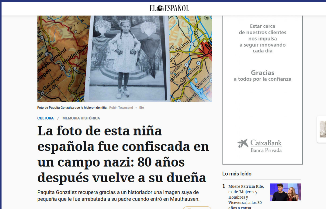
La foto de esta niña española fue confiscada en un campo nazi: 80 años después vuelve a su dueña - El Español 5 agosto 2019