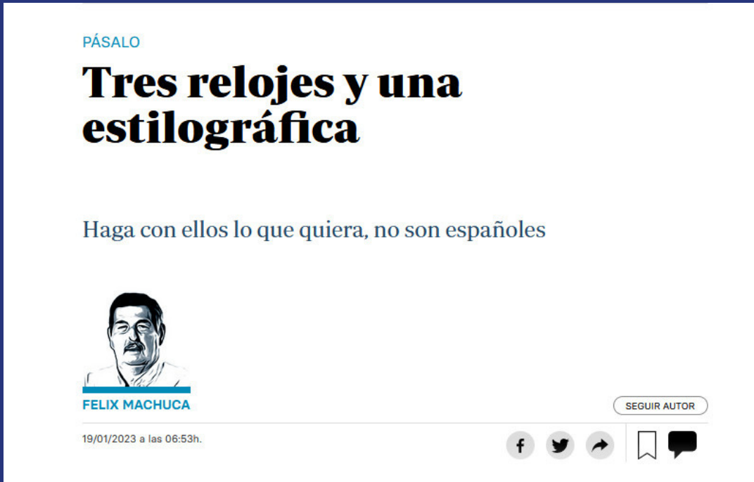
Tres relojes y una estilográfica, Feliz Machuca - ABC 19 enero 2023