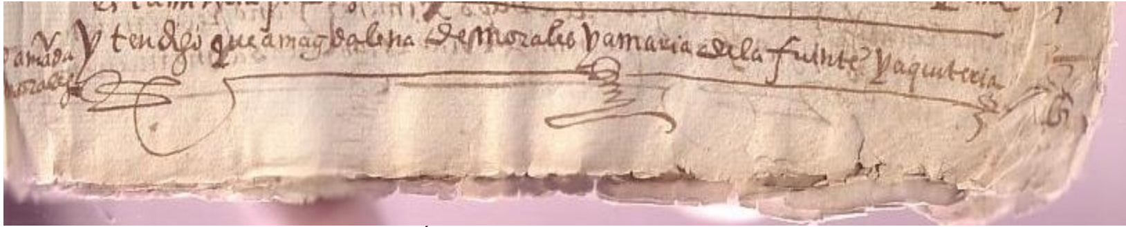
Último renglón de la página anterior