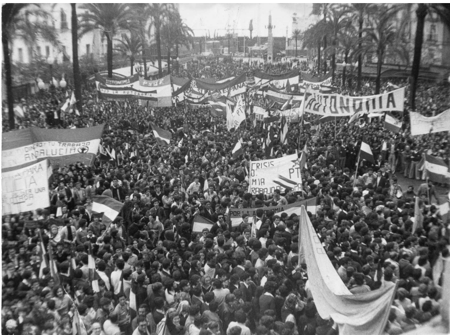
Manifestación del 4 de Diciembre en Cádiz.