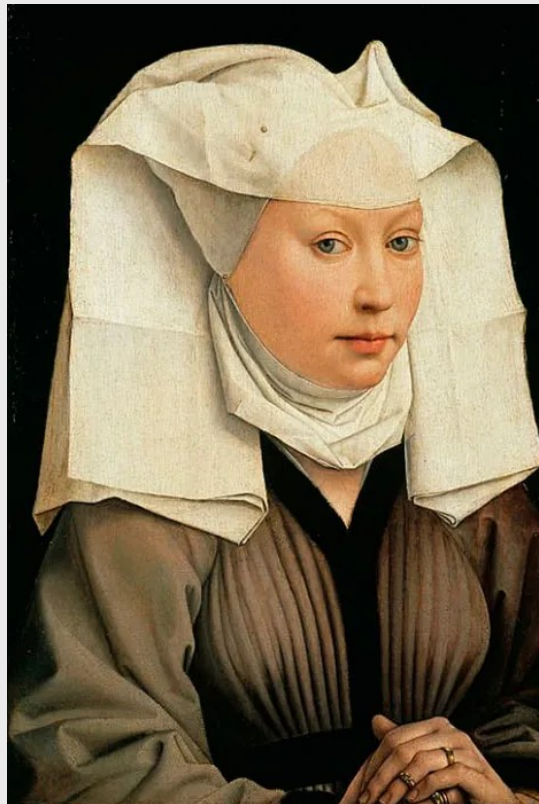
Retrato de una beguina, Robert Campin (National Gallery, Londres)

Desde el punto de vista teológico, todo gira en torno al amor, hacia Jesucristo y hacia los seres humanos. El individuo debe amar a Dios, abandonarse a sí mismo y consagrarse a él. Otro de los pilares del proyecto de las beguinas es el trabajo y el servicio, “trabajar esforzadamente sin protestar en completa humildad y obediencia”. Una de las cuestiones clave para las beguinas era la libertad, la persona ha de ser libre y actuar con libertad porque Dios ha creado al ser humano libre y porque al Amor se sirve en libertad. La caridad y el servicio al prójimo, especialmente a los necesitados son otro de los cauces de su actividad. El magisterio es una más de las vías de servicio a los demás, pues se entiende que hay que atender todas las carencias y no sólo las materiales.