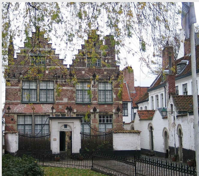
Beguinage de Conique

la corona hasta 1713). El hecho de que en los siglos XVI-XVIII las rutas del comercio internacional se trasladaran al eje atlántico hace que en la Baja Andalucía se instalasen en este periodo varias colonias de comerciantes extranjeros. En el caso de Cádiz su decisivo protagonismo en el comercio americano le confiere un especial atractivo para las comunidades de comerciantes extranjeros, sobre todo desde el último cuarto del siglo XVII y con el posterior traslado de la Casa de Contratación, además de ser punto de encuentro del comercio mediterráneo con el atlántico. Los flamencos además eran considerados súbditos del rey de España y podían comerciar con Indias una vez naturalizados, el hecho de que fuesen católicos facilitaba su integración.