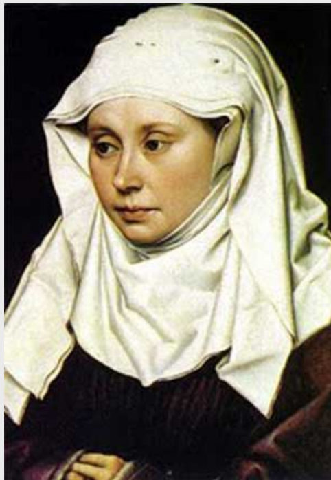
Retrato de una mujer, Robert Campin (National Gallery, Londres)

beguinas continuaron siendo fieles a la ortodoxia de la Iglesia católica, especialmente en Brujas, Gante y otras ciudades flamencas aunque muchas de ellas se incorporaron a órdenes religiosas reconocidas por el papado.