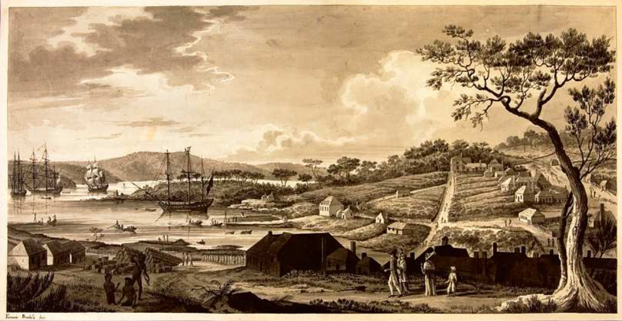
Vista de la Colonia Inglesa de Sydney en la Nueva Gales Meridional.