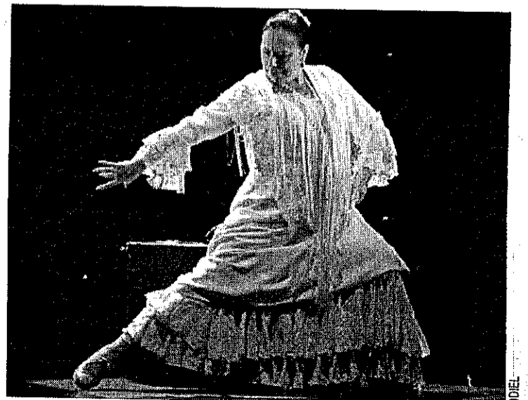
ARTE. La bailaora Cristina Hoyos lleva su arte hoy a la Sierra.

Cristina Hoyos cuenta a su vez con numerosos premios y galardones, entre los que destacan el Premio Nacional de Danza, la Medalla de Oro de Andalucía, la Medalla de Oro de las Bellas Artes y el Premio Andalucía de Cultura, entre otros reconocimientos a la bailaora andaluza.