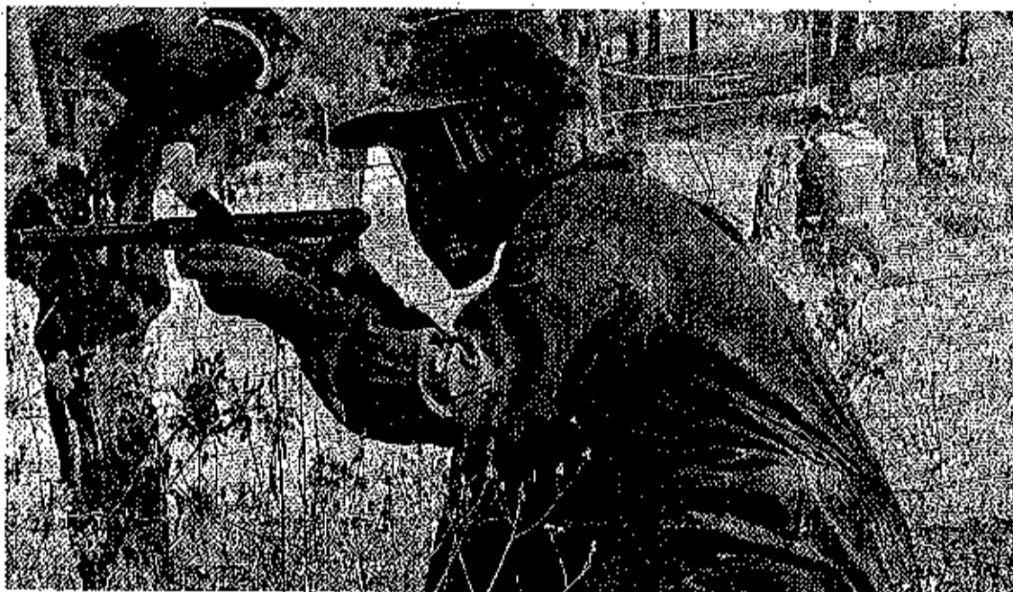
PAINTBALL. Los jóvenes rociateros afinarán sus puntería durante la Semana de la Juventud. CARLOS LÓPEZ

El 'Paintball' y el trial inundarán la I Semana de la Juventud, a la que se sumarán en paralelo un torneo de fútbol-sala, un concurso de fotografía y aventuras en tierras gaditanas