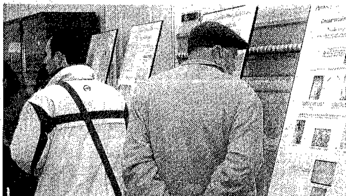
PRECEDENTE. La muestra estuvo expuesta al público el pasado mes de febrero en el Palacio de Mora Claros.

Los documentos conservados y custodiados en el Archivo Histórico Provincial, estará expuesta en el Centro de Día de Personas Mayores de Valverde. Dichas reproducciones se agrupan en torno a seis temas: el territorio,