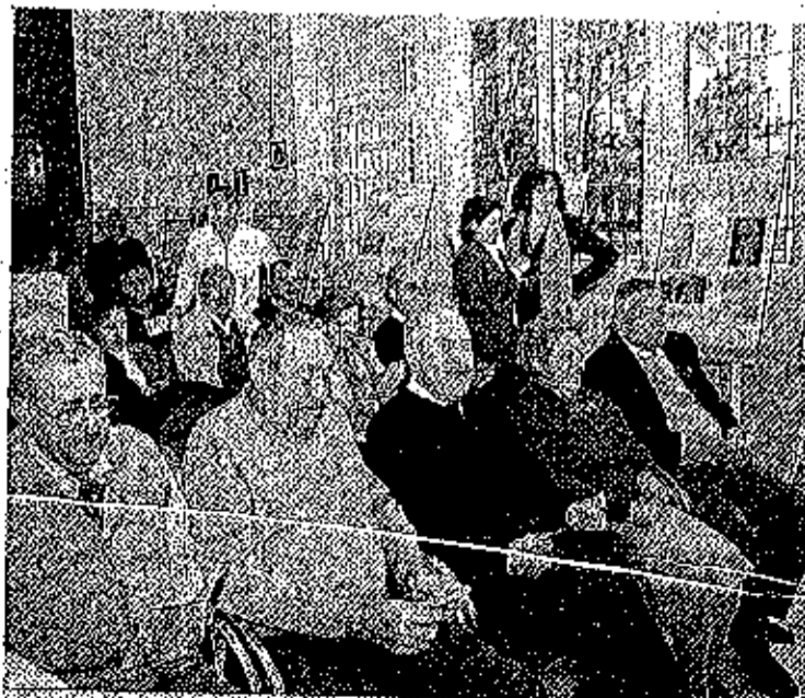
INAUGURACIÓN. Decenas de personas asistieron a la presentación.

En la sección de Sociedad, destaca a carta de libertad de un esclavo negro fechada en 1579, el reparto de beneficencia en 1964 por el Gobernador Civil en la campaña de Navidad o el expediente de emigrante a Alemania de 1968, que incorpora una placa radiográfica pulmonar de 60 x 60 mms.