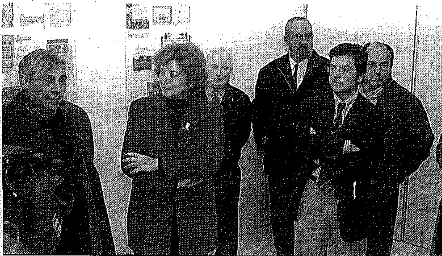
EXPOSICIÓN. La muestra fue inaugurada ayer en la Asociación de Vecinos del Matadero por la delegada de Cultura Guadalupe Ruiz.

que dice que "la experiencia nos dice que la gente apenas hace usos de las instalaciones culturales o bibliotecas y menos los archivos que parece que sólo queda para los sesudos universitarios". Así que se ha puesto en marcha una exposición que "quiere llegar al ciudadano, con una exposición en la que se muestran reproducciones de documentos y así se puede llegar a cualquier sitio".