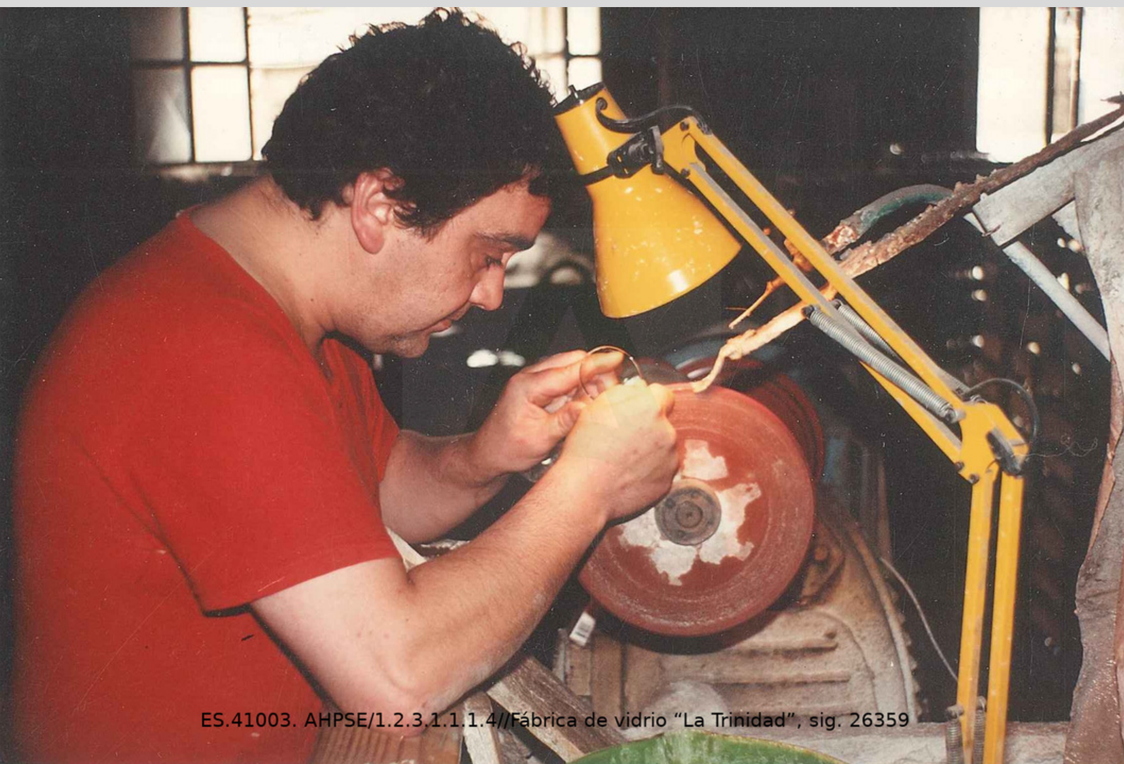
ES.41003. AHPSE/1.2.3.1.1.1.4//Fábrica de vidrio "La Trinidad", sig. 26359