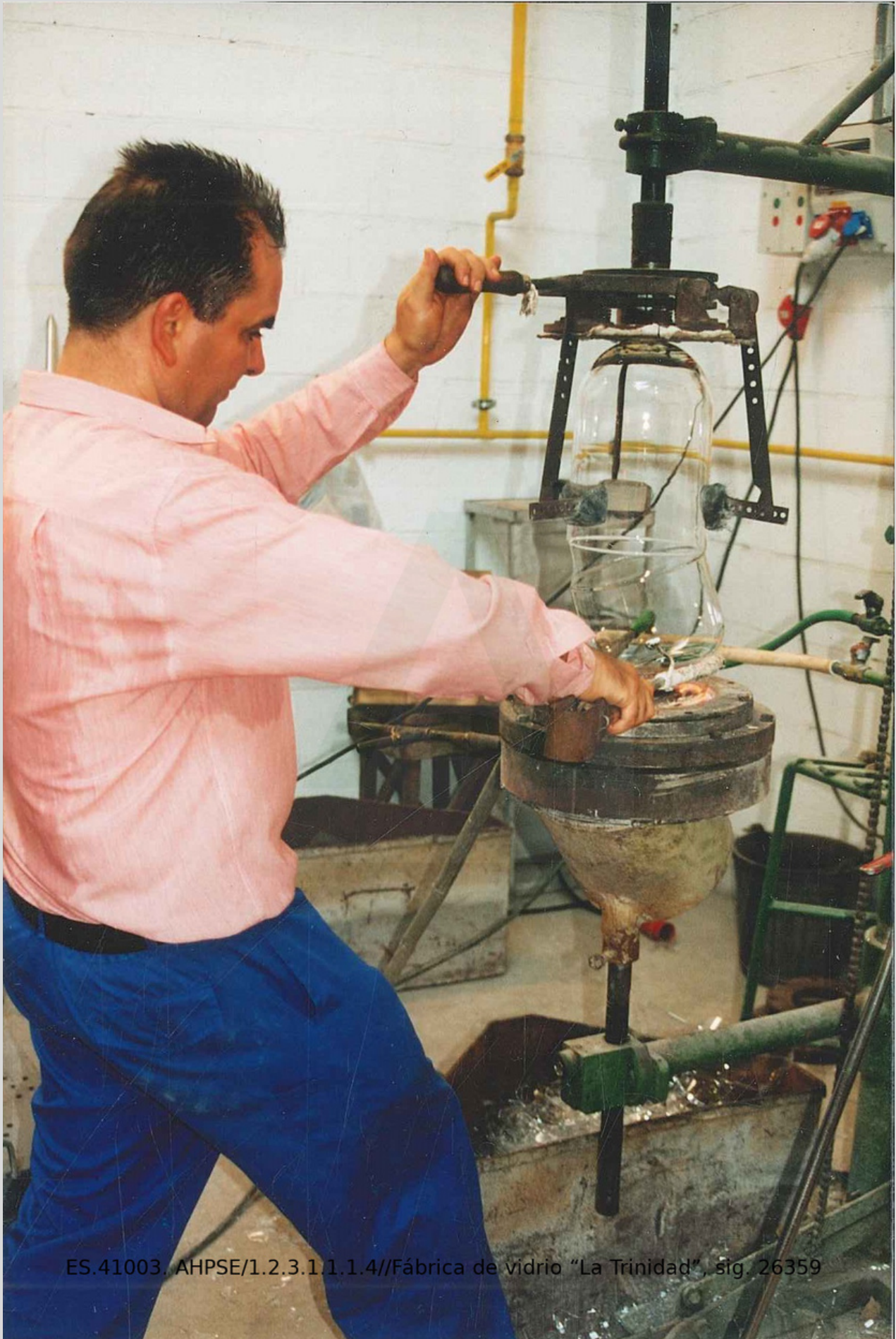
ES.41003. AHPSE/1.2.3.1.1.1.4//Fábrica de vidrio "La Trinidad", sig. 26359