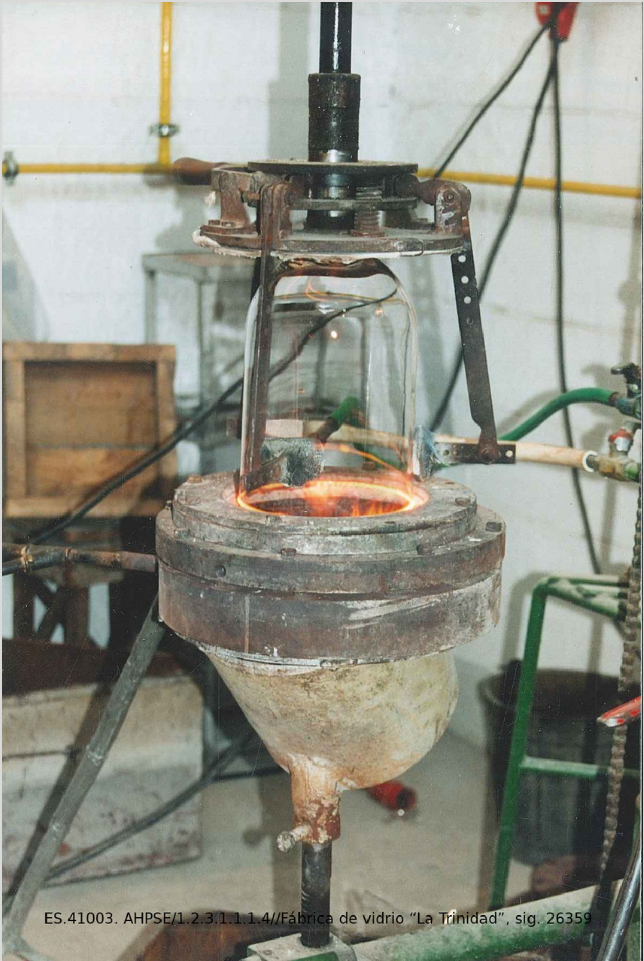
ES.41003. AHPSE/1.2.3.1.1.1.4//Fábrica de vidrio "La Trinidad", sig. 26359