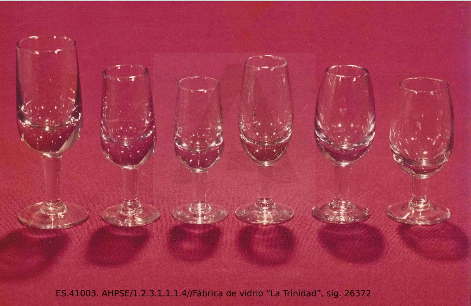
ES.41003. AHPSE/1.2.3.1.1.1.4//Fábrica de vidrio "La Trinidad", sig. 26372