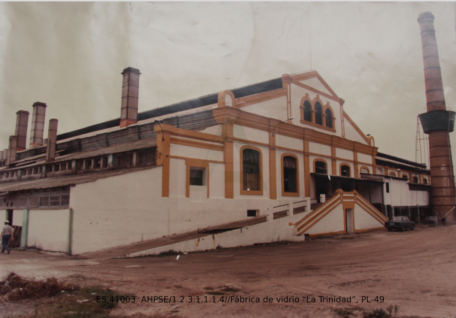
ES.41003. AHPSE/1.2.3.1.1.1.4//Fábrica de vidrio "La Trinidad", PL-49