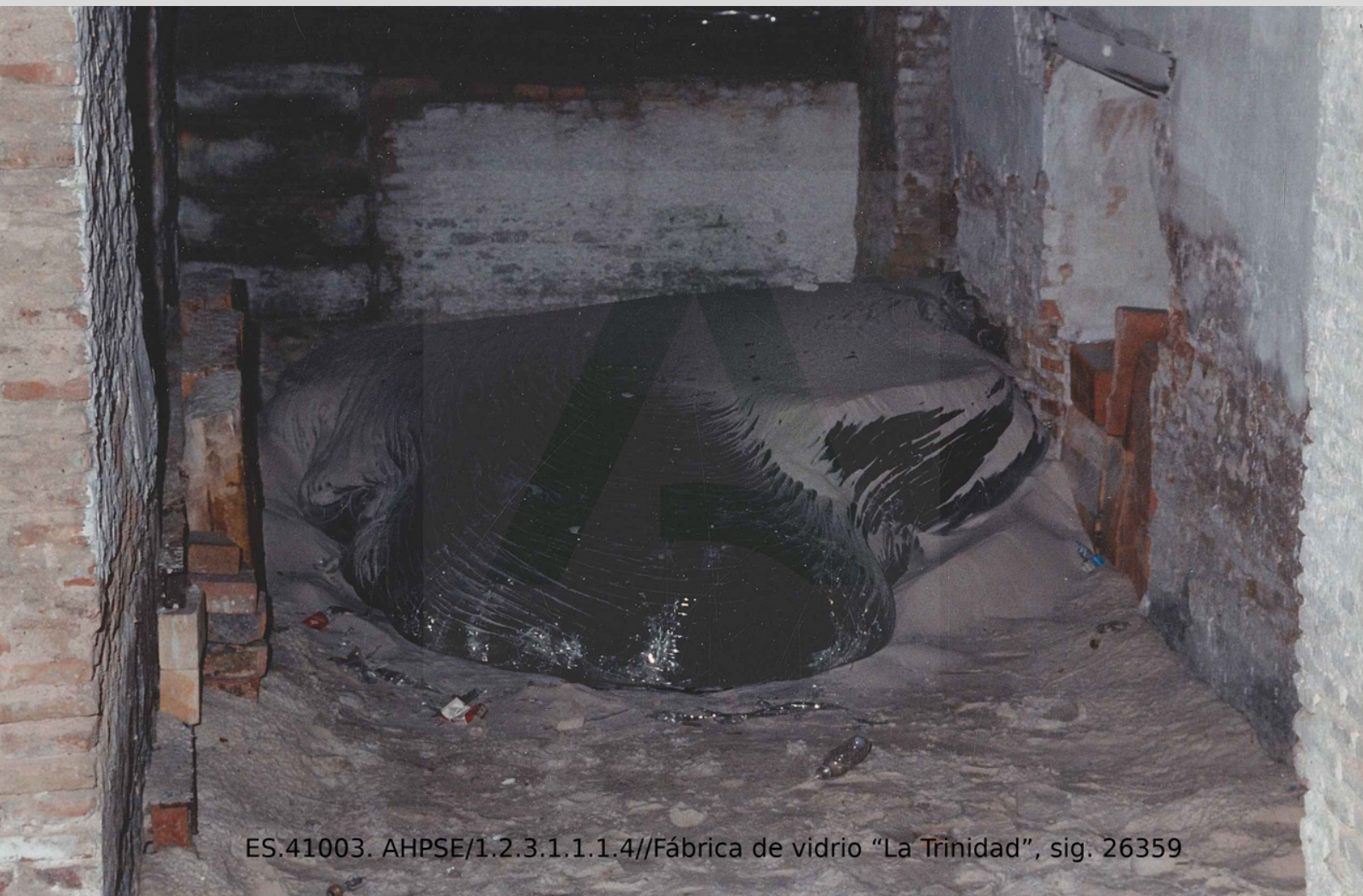
ES.41003. AHPSE/1.2.3.1.1.1.4//Fábrica de vidrio "La Trinidad", sig. 26359