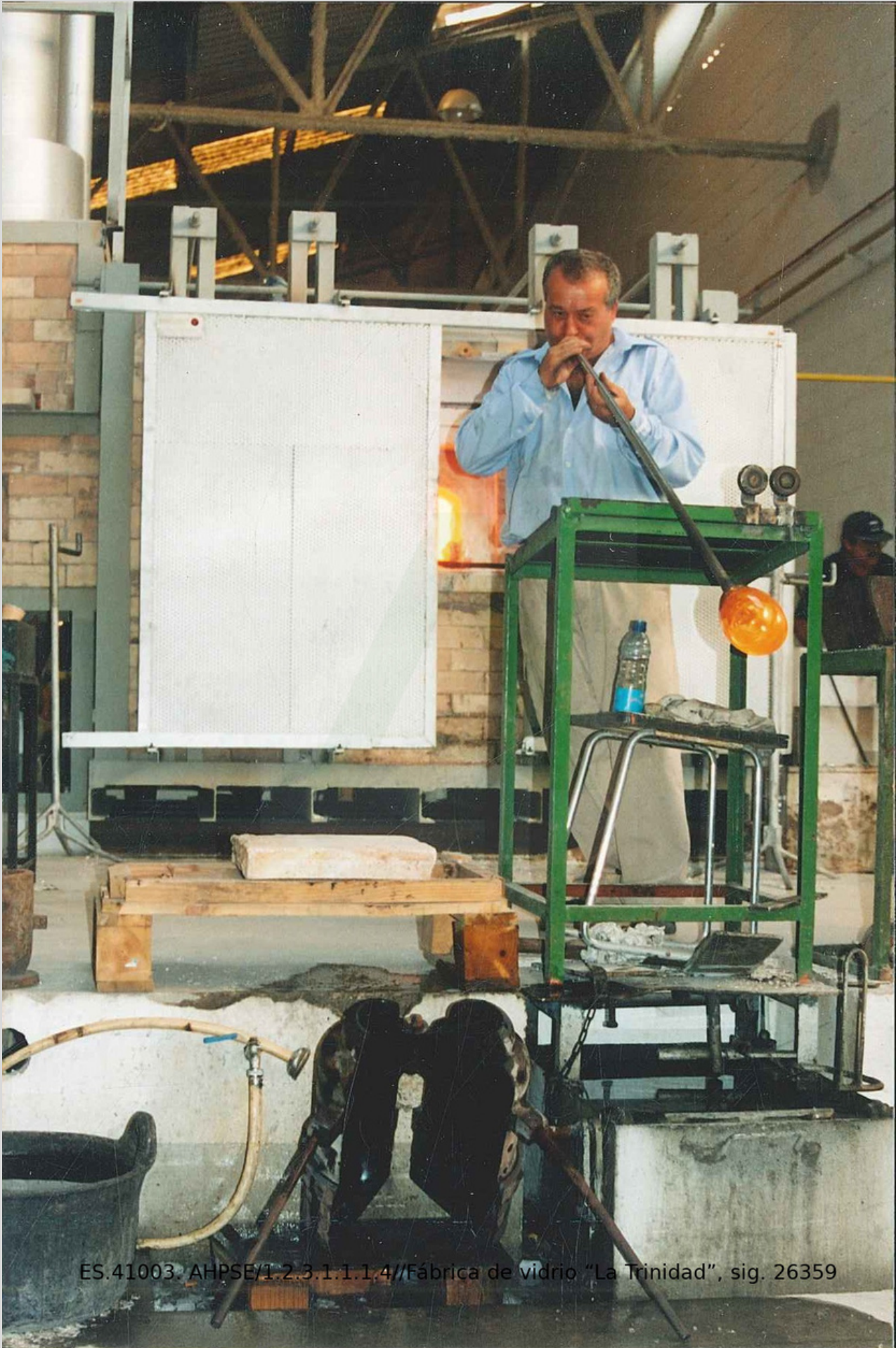
ES.41003. AHPSE/1.2.3.1.1.1.4//Fábrica de vidrio "La Trinidad", sig. 26359