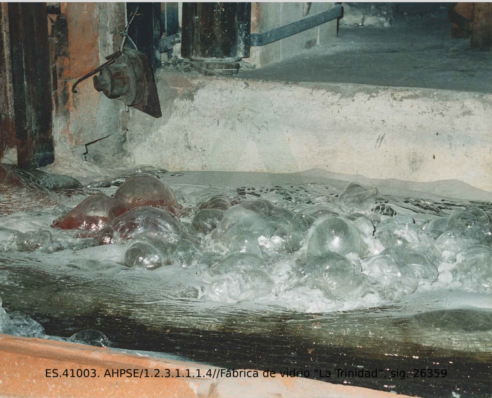
ES.41003. AHPSE/1.2.3.1.1.1.4//Fábrica de vidrio "La Trinidad", sig. 26359