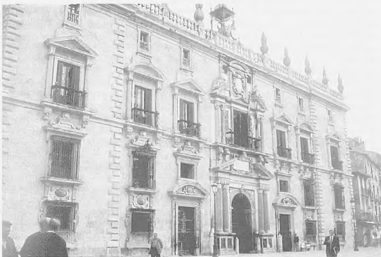
Fachada del Palacio de la Chancillería. Plaza Nueva, Granada

El Archivo tiene su origen en la necesidad de custodia y servicio de los documentos producidos por la Real Chancillería de Granada, y se establece su existencia y régimen de funcionamiento en las Ordenanzas de la Chancillería de Valladolid de 1489, en las primeras de Ciudad Real-Granada otorgadas en Segovia el 30 de septiembre de 1494, y en las posteriores ediciones y reimpressiones de éstas de Granada, tanto la de 1551 como la de 1601. Por tanto podemos concebir este Archivo en la categoría de depósito natural, entendido como aquel que se va formando en el mismo lugar dónde se producen los documentos; aunque no siempre los fondos estuvieron reunidos bajo un mismo techo. En efecto, desde su traslación a Granada, el Alto Tribunal mantuvo sus fondos repartidos en distintas dependencias: bien en la propia sede del Tribunal en su palacio de la Plaza Nueva, en el caso de la documentación producida por la Secretaría de la Presidencia, la Secretaría del Real Acuerdo, el Registro de Chancillería y por las