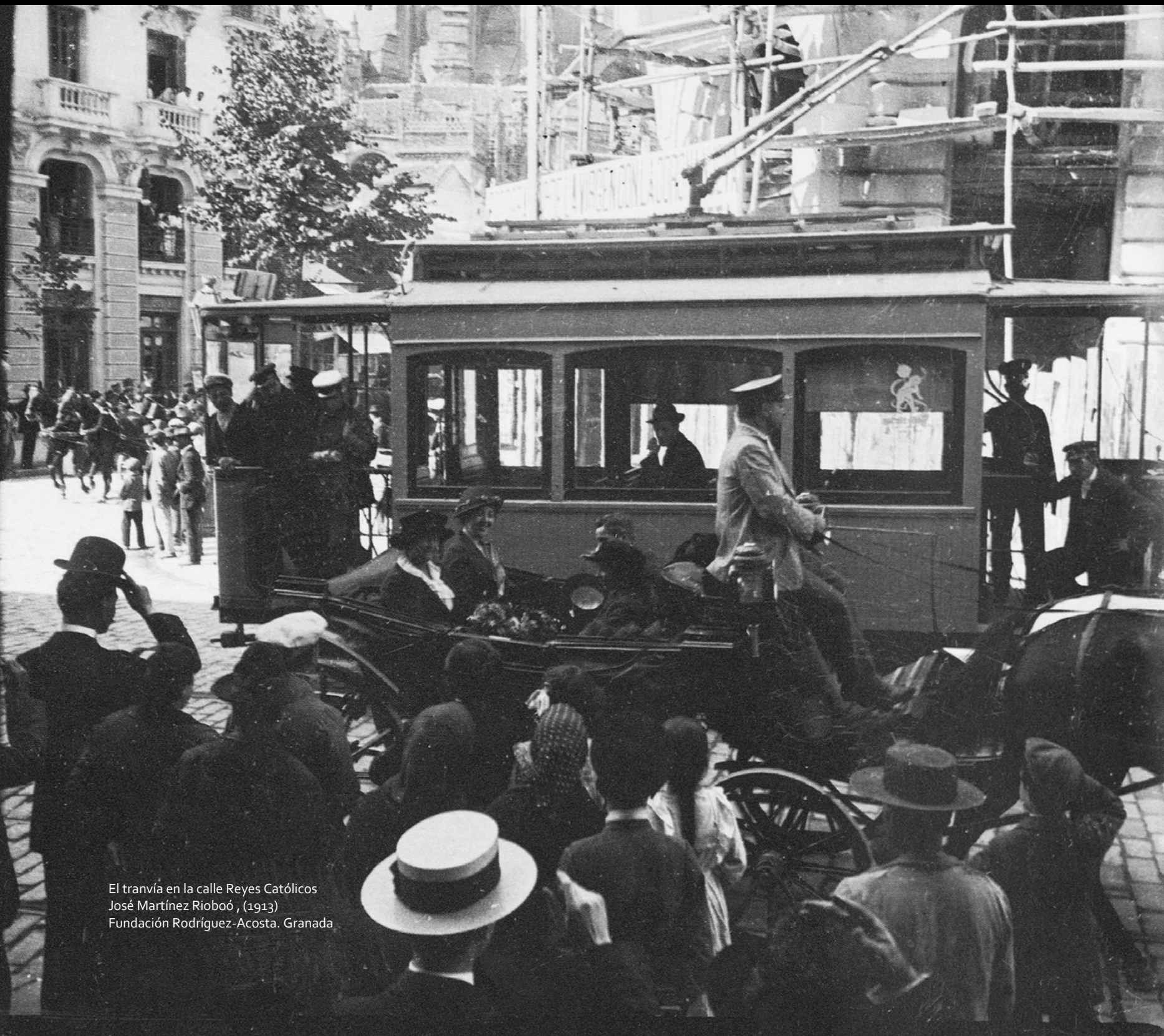
El tranvía en la calle Reyes Católicos José Martínez Rioboó, (1913) Fundación Rodríguez-Acosta. Granada