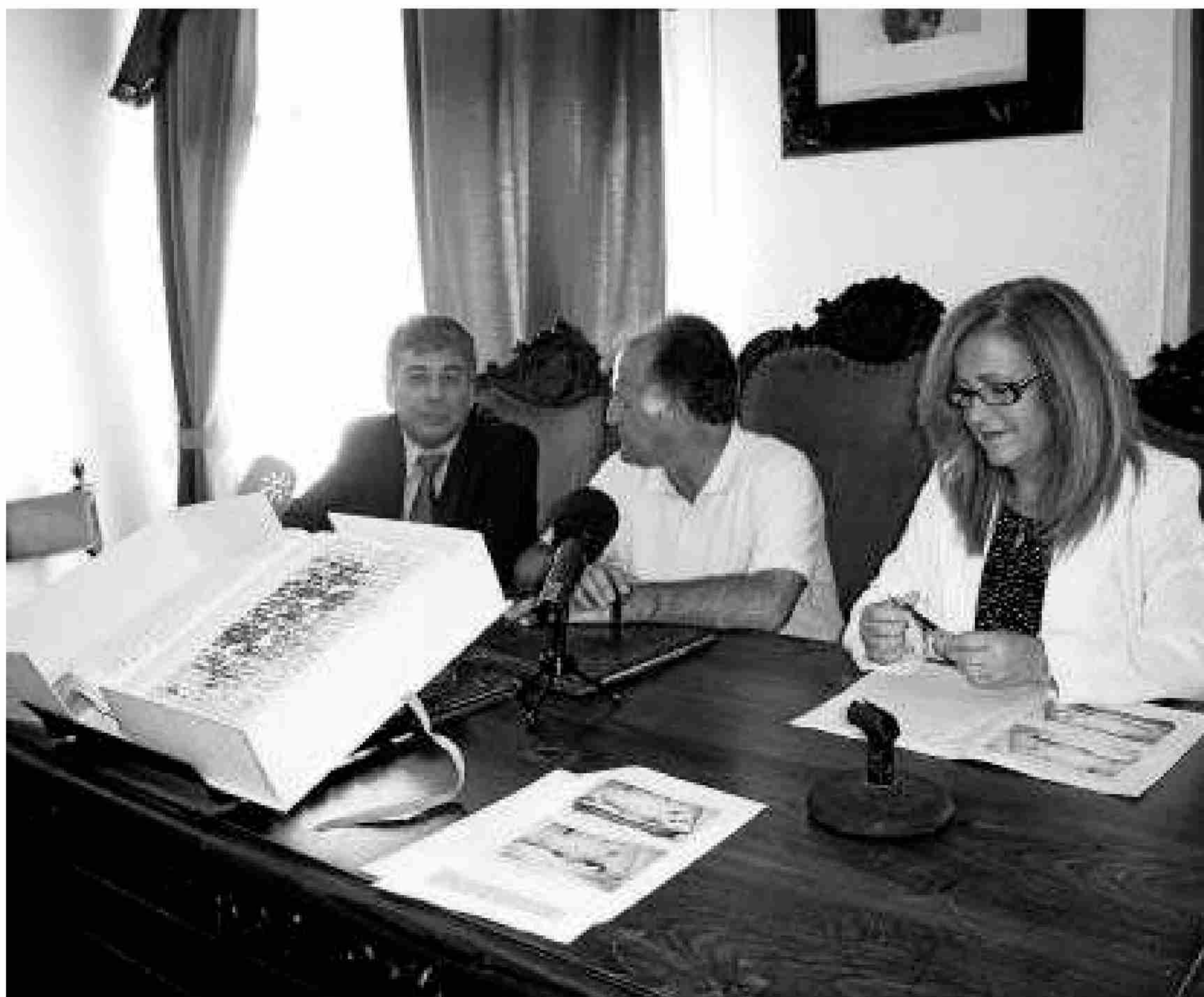
Imagen de la entrega del tercer tomo de las Actas Capitulares en Tarifa, ayer.

En consecuencia, el Gobierno gibraltareño recibió la proposición con agrado han decidido llevar a cabo la idea para preservar el nombre del artista local, que ha sido la primera persona a la que se la ha concedido el Honorary Freedom de la ciudad de Gibraltar en 1962.