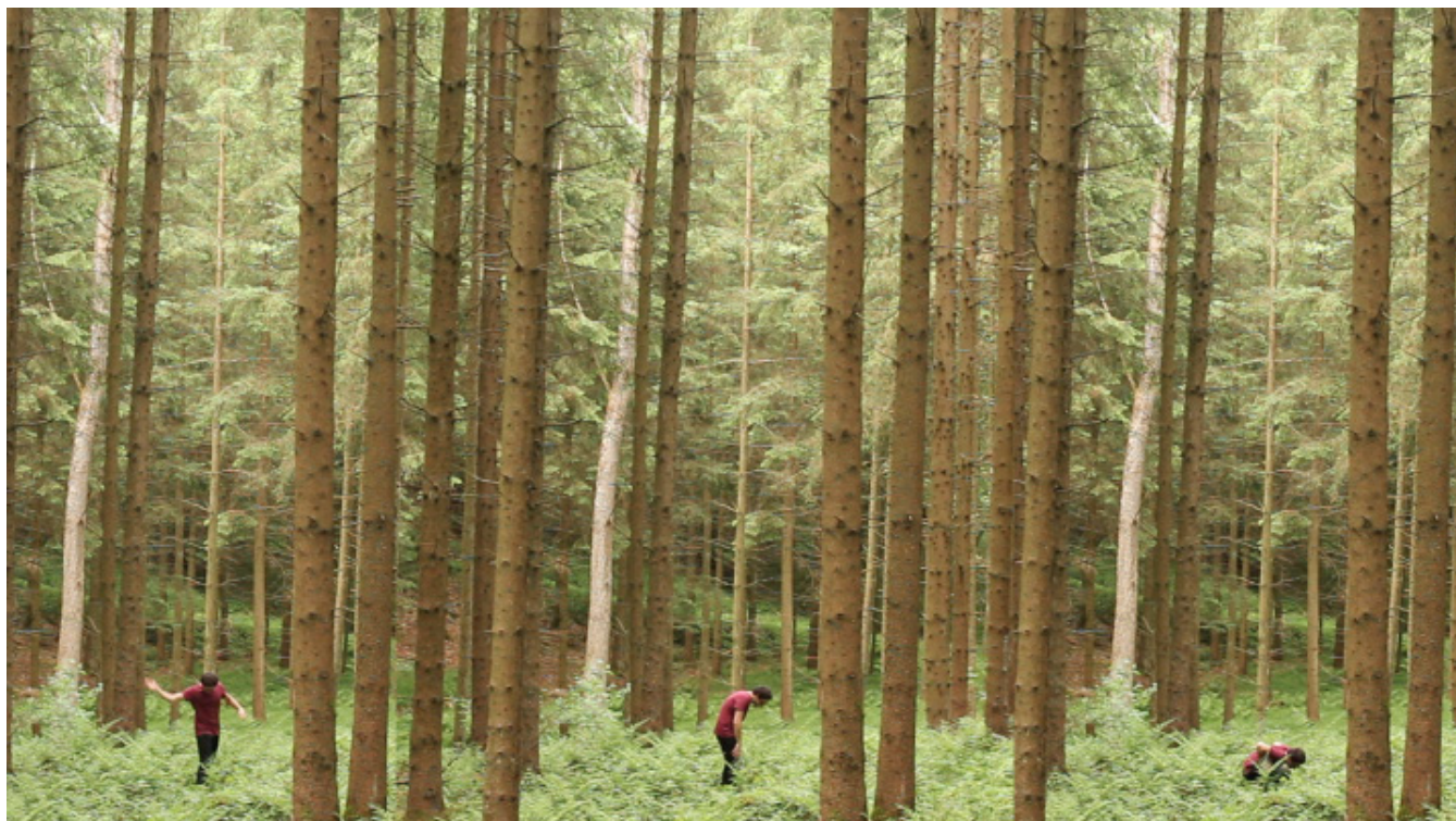
Dentro de campo "La disección lúcida" 2013