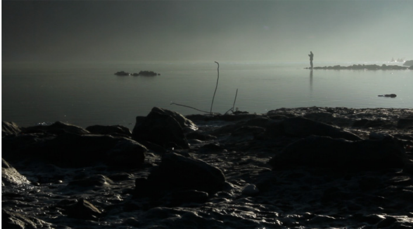
El caminante sobre el río de niebla “La disección lúcida” 2013