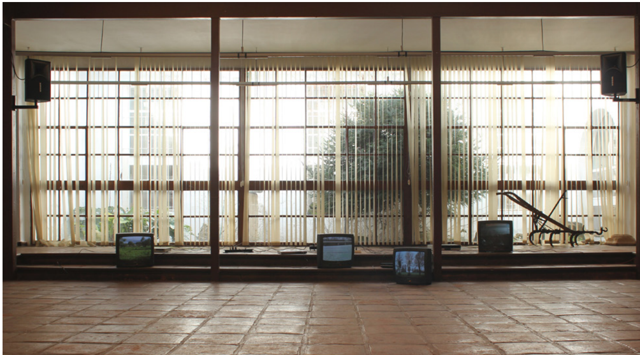
Las Postales del Museo (2014) es un proyecto instalativo adaptado al espacio del Museo Arqueológico de Santaella. La instalación establece relaciones entre la idea de postal adquirida en un museo y el concepto de "vídeo-postal", en el que un plano fijo parece encapsular el tiempo.