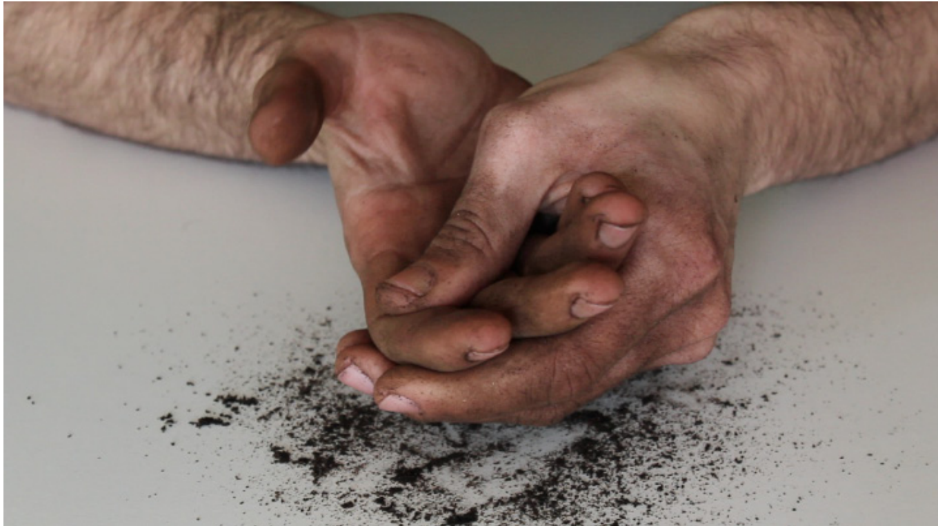
Abismo "La disección lúcida" 2013