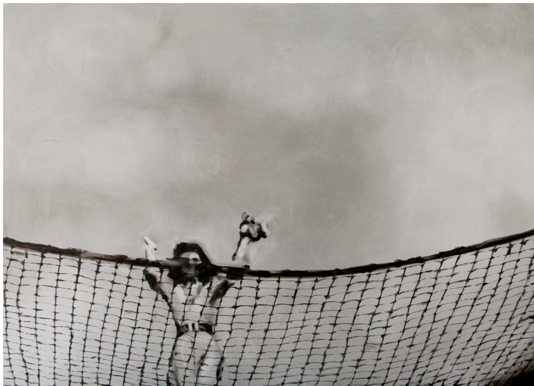
Sin título II (Anagnórisis). Óleo sobre tabla, 85 x 61 cm.