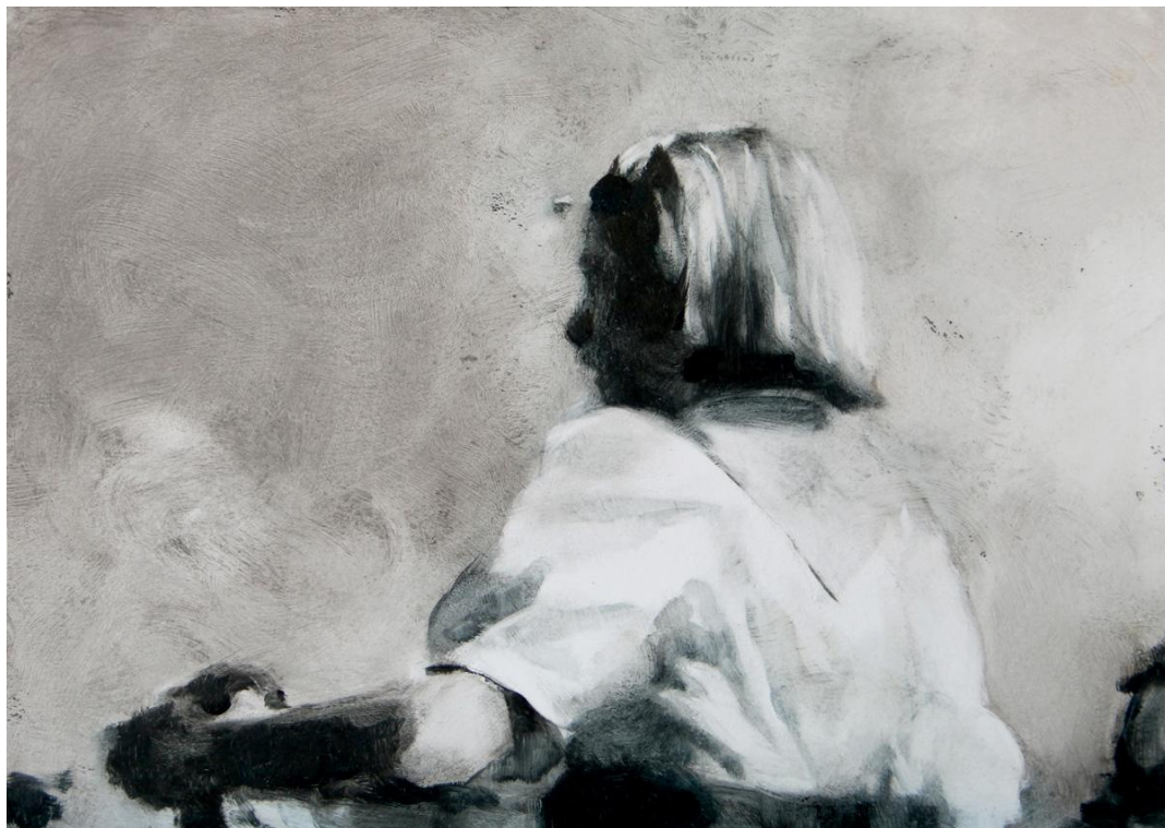
Sin título I (Anagnórisis) . Óleo sobre papel, 42 x 30 cm.