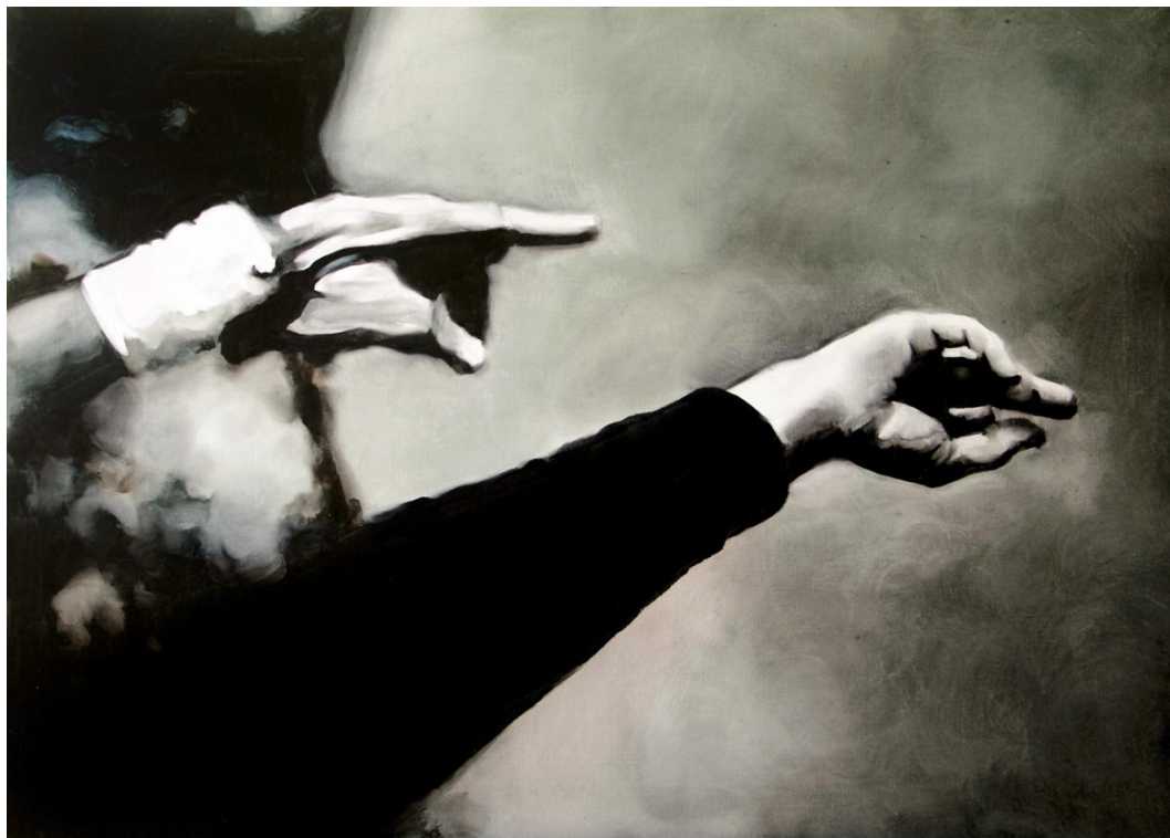
Sin título (La jetée) . Óleo sobre tabla, 85 x 61 cm.