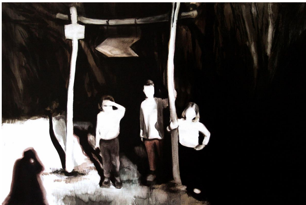
Sin título (Refugio) . Óleo sobre tabla, 61 x 41 cm.