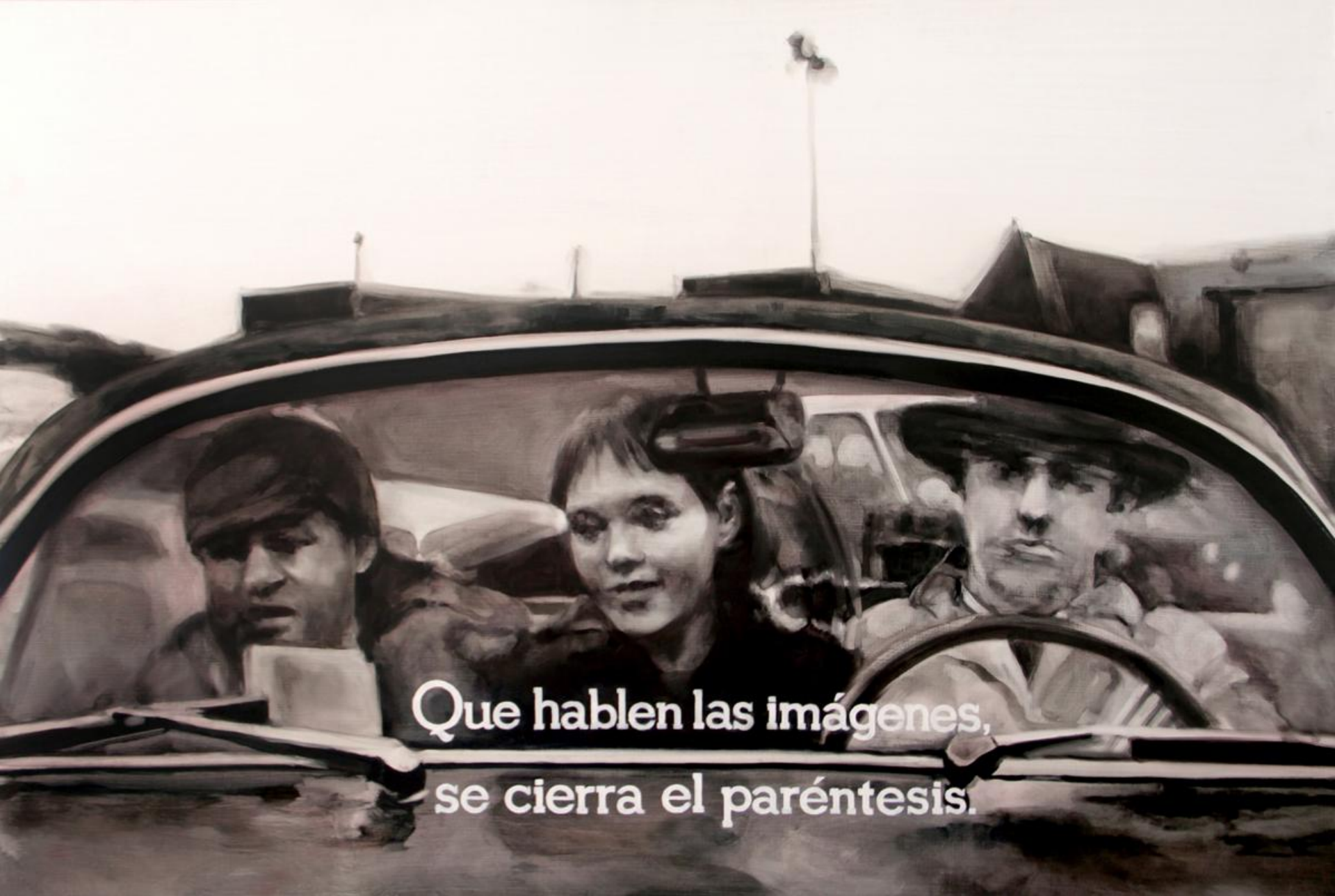
Sin título (La parenthèse fermante). Óleo sobre tabla, 122 x 81 cm.