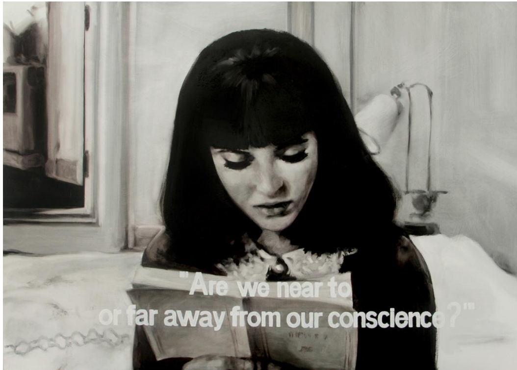
Sin título (Conscience). Óleo sobre tabla, 85 x 61 cm.