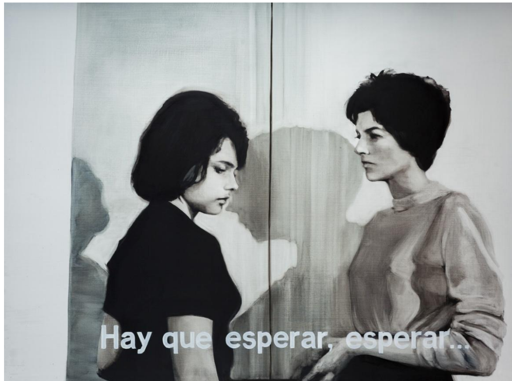
Palabras incomprendidas II. Óleo sobre tabla, 162 x 130 cm.