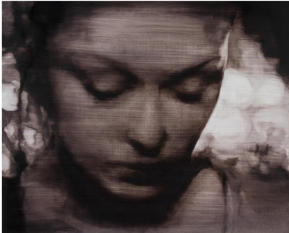
Silente. Óleo sobre tabla, 81 x 65 cm.