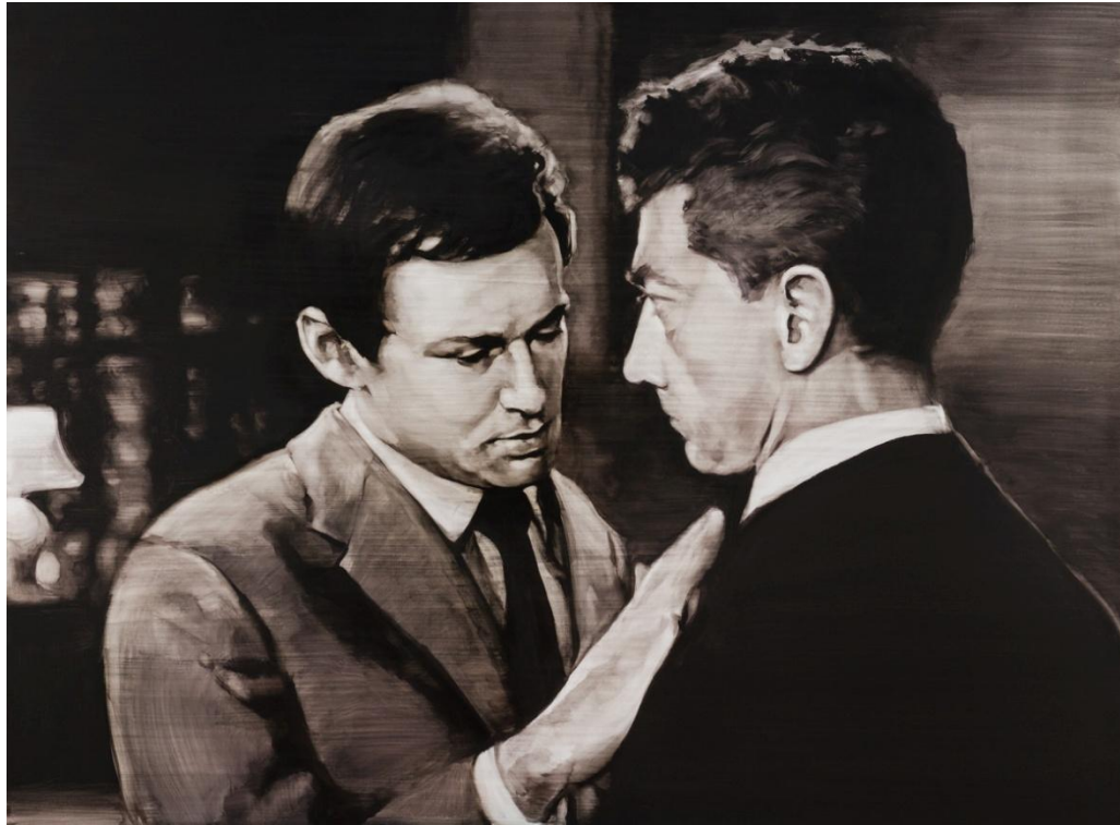
Distance. Óleo sobre tabla, 150 x 110 cm.