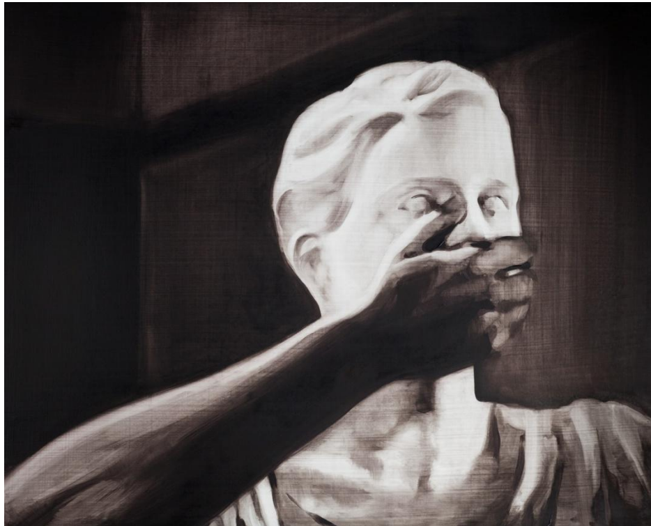
Essaie. Óleo sobre tabla, 81 x 65 cm.