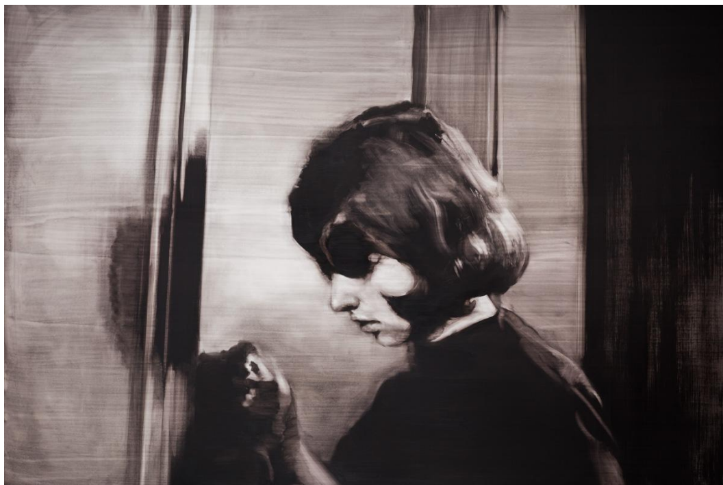
Absence II. Óleo sobre tabla, 146 x 97 cm.