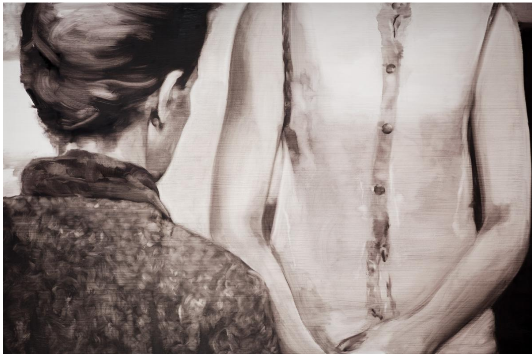
Sin título I. Óleo sobre tabla, 146 x 97 cm.