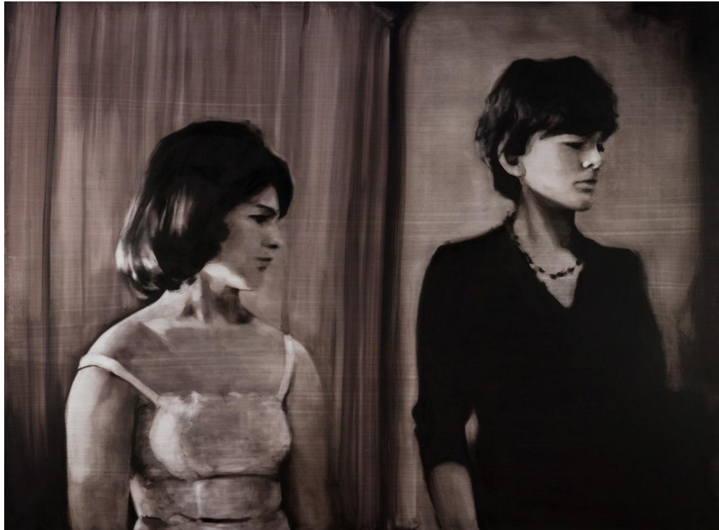
Arqueología del observador IV. Óleo sobre tabla, 162 x 130 cm.