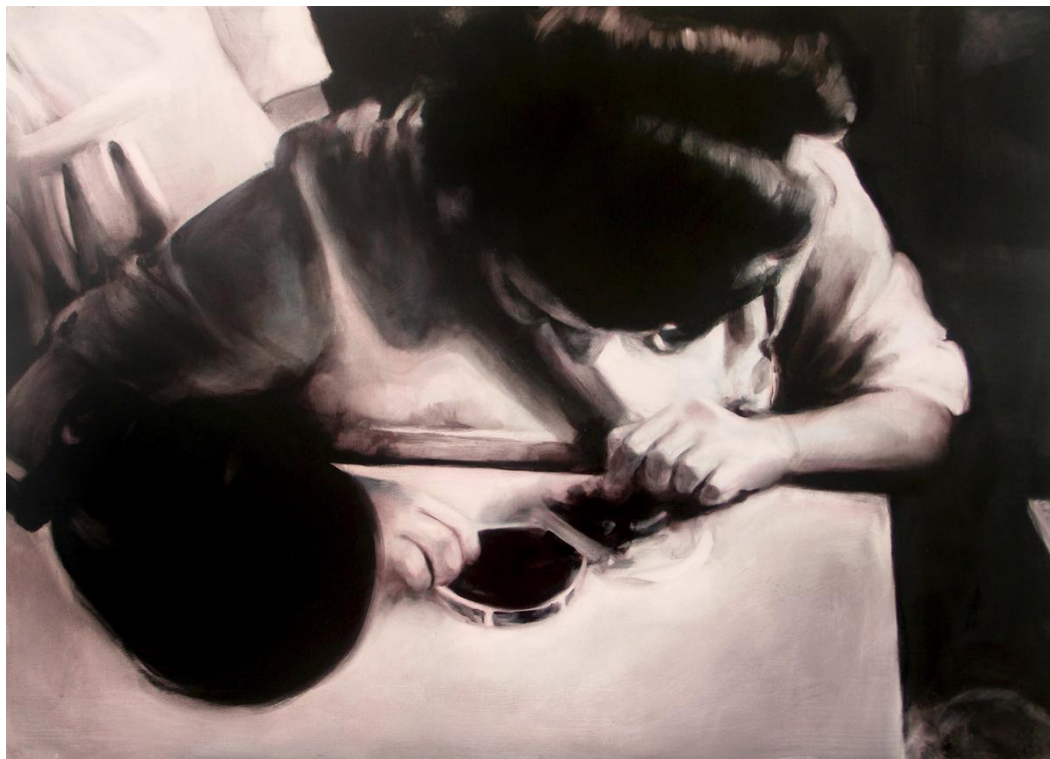
Sin título II (La trama). Óleo sobre tabla, 85 x 61 cm.