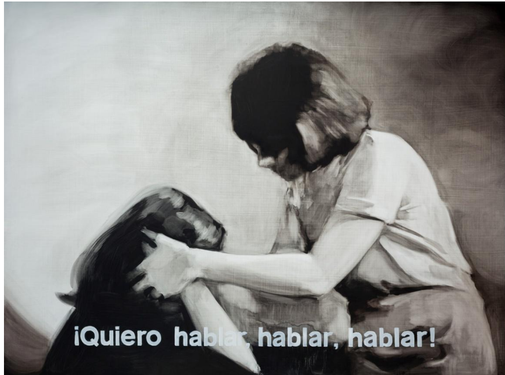
Palabras incompresas I. Óleo sobre tabla, 162 x 130 cm.