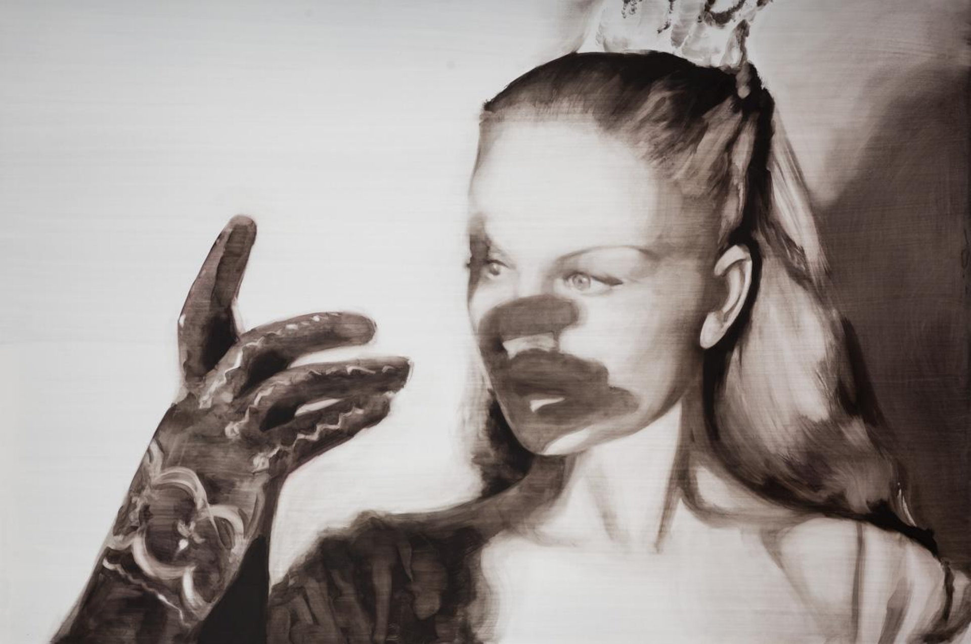
Masque. Óleo sobre tabla, 146 x 97 cm.