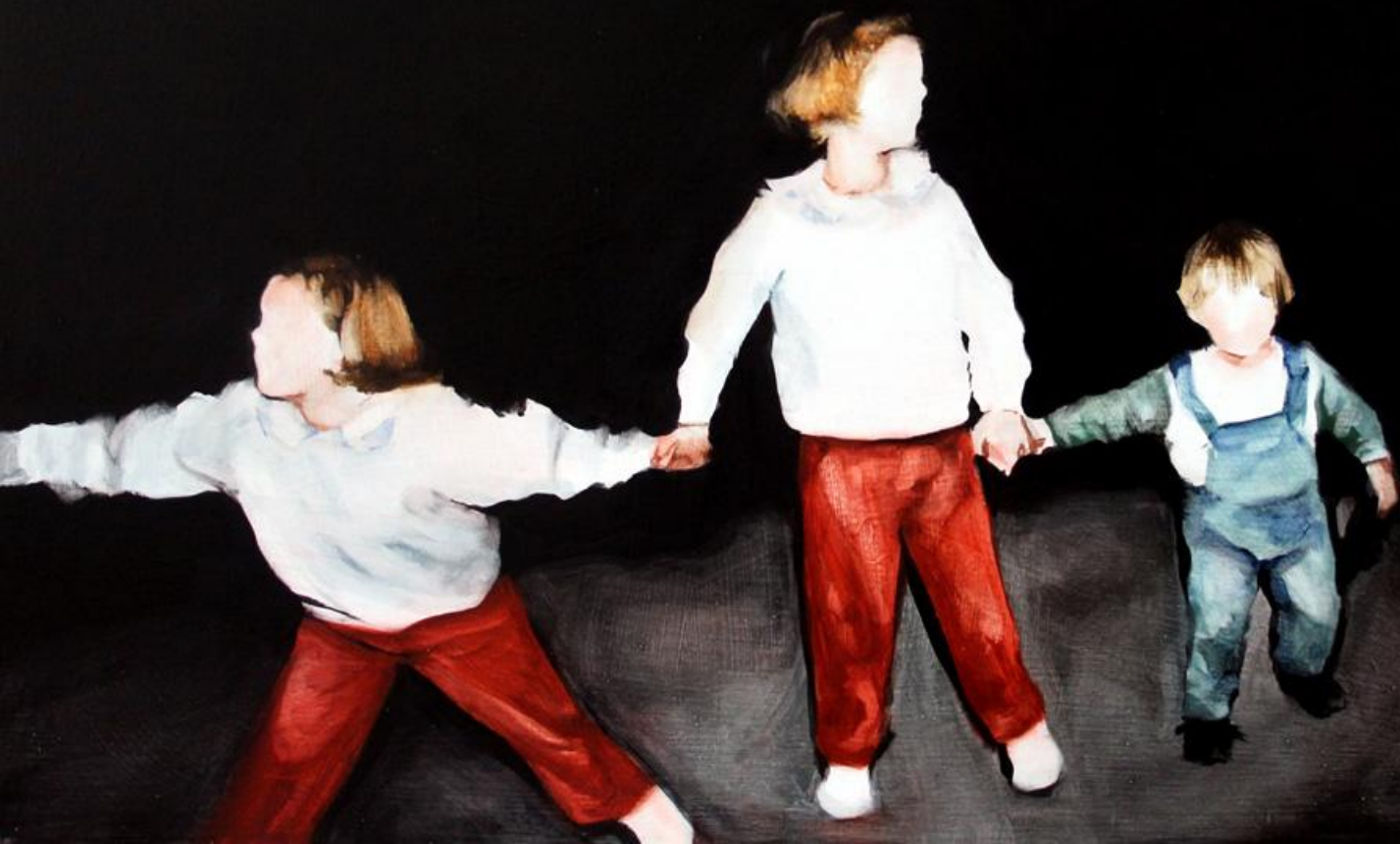
Sin título (Cave) . Óleo sobre tabla, 61 x 41 cm.