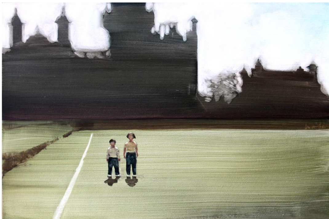
Sin título (Sol sistere I). Óleo sobre tabla, 61 x 41 cm.