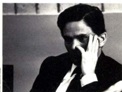
Pier Paolo Pasolini en 1965 (page 90).

En couverture: montage d'après des photos de Greta Gerwig (Vincent Lignier) et d'Abel Ferrara sur le tournage de Go Go Tales (Wild Bunch).