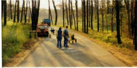
Prince of Texas de David Gordon Green (page 32)