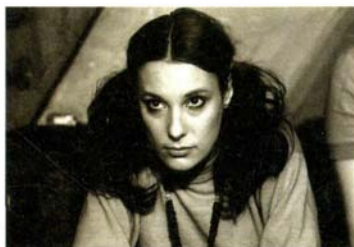
Bernadette Lafont dans Out 1 de Jacques Rivette (page 80).