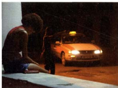
Grigris de Mahamat-Saleh Haroun (page 52).