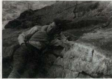
Jean Grémillon sur le tournage de Tour au large (page 66).