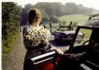
Dominique Sanda dans Une femme douce de Robert Bresson (page 90).