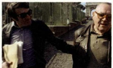
Le Dernier des injustes de Claude Lanzmann (page 50).