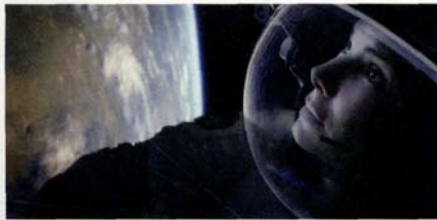
Gravity d'Alfonso Cuarón (page 36)