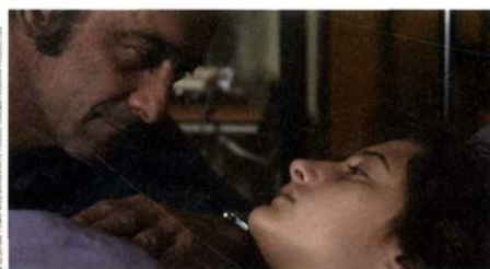
Les Salauds de Claire Denis (page 82).