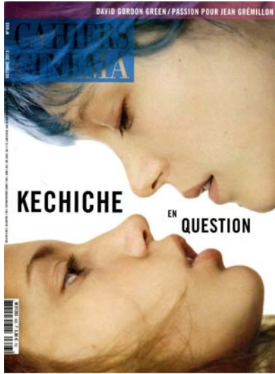
Adèle Exarchopoulos et Léa Seydoux dans La Vie d'Adèle d'Abdellatif Kechiche (ouverture et page 6).