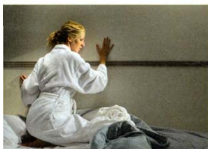
Sandrine Kiberlain dans Tip Top de Serge Bozon (page 43).