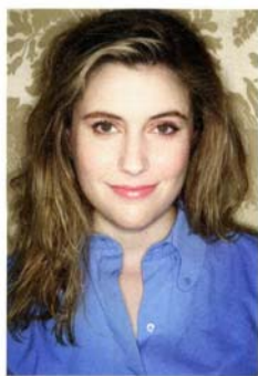
Greta Gerwig par Vincent Lignier pour les Cahiers du cinéma, Paris, juin 2013 (page 18).