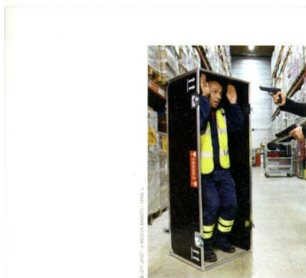
Éric Judor dans Platane , saison 2 (page 8).