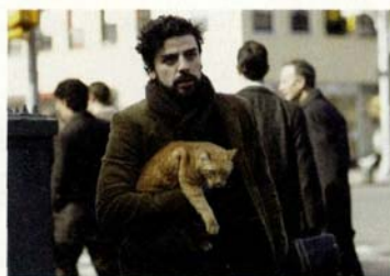
Inside Llewyn Davis de Joel et Ethan Coen (couverture et page 6).