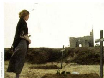
L'Île aux trente ceruils de Marcel Chavanne (page 90).

Illustration de couverture : Éric Judor par Dustin Cohen pour les Cahiers du cinéma.