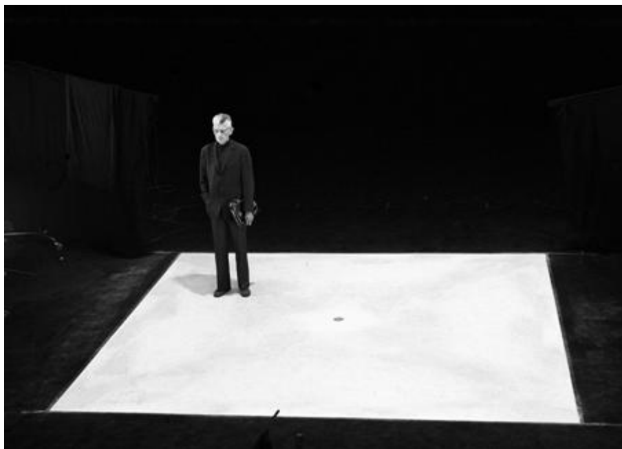
Samuel Beckett en el plató de Quad I+II, Stuttgart, 1981.