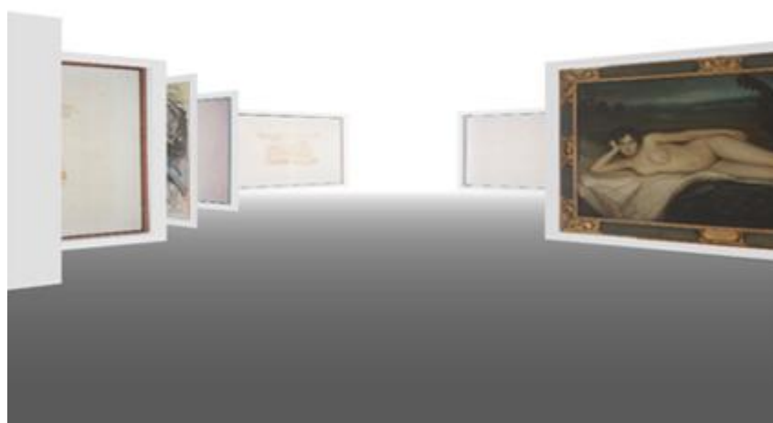
Diseño del proyecto CAAC COLECCIÓN / N EXPOSICIONES . Pierre Giner