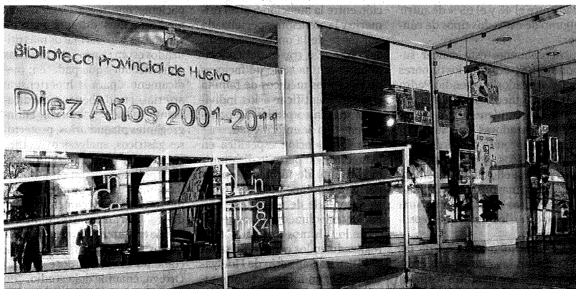
Cartel de los 'Diez años' a la entrada de la Biblioteca.

Sí, sí, siempre. A mí me gustaría hablar de algo más que de diez