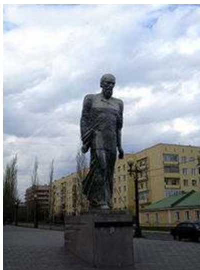
Estatua de Dostoyevski en Omsk.

“En verdad, en verdad os digo que si el grano de trigo que cae en la tierra no muere, queda solo, pero si muere produce mucho fruto”