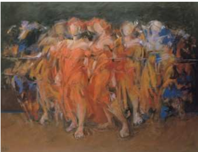
Desfile II, 1999.