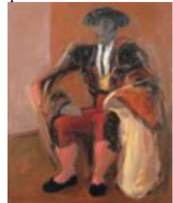
De Rojo y Azabache, 1999.

Y yo quise traspasar los misterios del aire que envuelve, dionisiaco y fecundo, lo esencial de la obra de Mario León. Intenté adentrarme en el mundo dorado e insomne de su fiebre. En el paraíso cerrado de su verdad poblada de fantasmas azules. En el latido cárdeno que convoca soledades hermosas. En el bosque florido de misterios que congrega malditas y perversas y santas oraciones. Quise mirar tras el tapial abierto de su jardín mojado para sentir la sangre de su ceremonial y lúbrica inocencia: la música coral de los colores que inventa su litúrgica emoción.