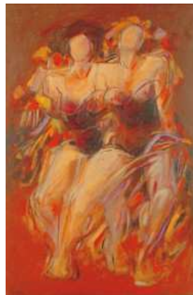
Las Muchachas del Coro, 2000.

Un día, hace ya mucho tiempo, me adentré en el refugio, en el templo donde Mario León oficia de sencillo