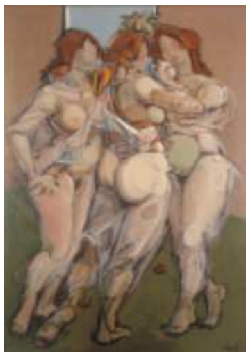
Tres Gracias I, 1986.

Y yo quise traspasar los misterios del aire que envuelve, dionisiaco y fecundo, lo esencial de la obra de Mario León. Intenté adentrarme en el mundo dorado e insomne de su fiebre. En el paraíso cerrado de su verdad poblada de fantasmas azules. En el latido cárdeno que convoca soledades hermosas. En el bosque florido de misterios que congrega malditas y perversas y santas oraciones. Quise mirar tras el tapial abierto de su jardín mojado para sentir la sangre de su ceremonial y lúbrica inocencia: la música coral de los colores que inventa su litúrgica emoción.