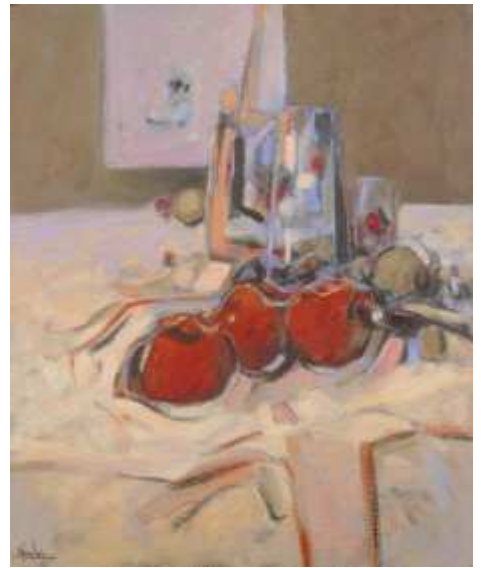
Tres Frutas Rojas, 2.000.

Mario León se encuentra en el río palpitante de turbias madrugadas de aguardiente donde todo es posible. Levantando la máscara ridícula y grosera para llegar al sitio donde esta agazapado el dios de la sorpresa. En el sublime beso de un poema del viento que asegura caricias tan dulces como el centro inaudito del misterio. Dentro de la mirada, tan triste y sorprendida, de la niña amarilla que descubre el bordón acuciante de la carne y no sabe olvidar su mundo de muñecas. Y en el caballo roto que galopa los prados amarillos de la imaginación infantilmente recobrada. Y en la lluvia bohemia de parisinas horas compartiendo colores y pan y prodigios canallas. Y dibujando gestos milenarios en el canto de amor de los tejados de verdín y maullidos. Y en la paz intangible de un humo de cigarro que lo mismo que un sueño erotiza el instante.