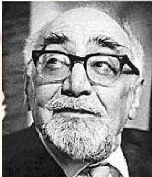
Ramón J. Sender

Pocos escritores como Ramón J. Sender Garcés , nacido en Chalamera de Cinca (Huesca) el 3 de febrero de 1901, han hecho perdurar tan bellamente en su memoria y en su obra los lugares de la infancia y de la adolescencia. Como claves de su sentimentalidad y cifras de su existencia, a veces como enclaves mágicos, desfilaron por sus libros (señaladamente en Crónica del alba ) los recuerdos natales de Chalamera, los infantiles de Alcolea, Tauste y Alcañiz, o los juveniles de Zaragoza y Huesca.