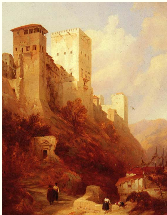
David Roberts. Torre de Comares, La Alhambra, Granada 1838

Pocos Granadinos van nunca a visitarla ni comprenden siquiera el interés total, la devoción concentrada que despierta en el forastero. La familiaridad en ellos ha dado lugar al menosprecio con que el beduino contempla las ruinas de Palmira, insensible a su presente belleza tanto como a su pasada poesía y aventura. Es triste la falta de aprecio hacia la Alhambra por parte de los naturales; completa en cierto modo la decadencia de la estructura, al quitar incluso a las ruinas su prestigio abstracto. Así son los orientales, a quienes basta su hoy para el día ; no se preocupan ni por el pasado ni por el futuro (...) ellos piensan sólo en el presente y en sí mismos, y como ellos la mayor parte de los españoles, aunque no lleven turbante (...) La historia de la degradación de la Alhambra merece ser registrada. Fue nuestro destino, durante dos residencias veraniegas en su recinto, conversar con muchos viejos cronistas, hijos de la Alhambra , que habían visto con sus propios ojos y oído de sus propios padres el avance de su decadencia y los agentes que la perpetraban.