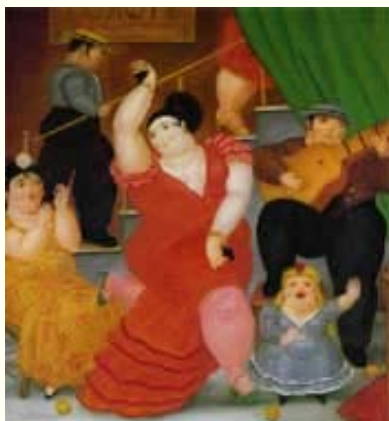
Tablao flamenco. Fernando Botero

Fue una velada horrible. Había caído en la trampa de un espectáculo para turistas, y de los peores: la danza era género Hollywood, con mucho taconeo y mucho movimiento de cabeza; el guitarrista, más que profundo, era hábil y de ágiles dedos, y su forma de tocar tendía al staccato; el cante corría por cuenta de un hombre con el pelo lleno de fijador y que llevaba un traje ajustado, y era más parecido a los Beatles que a moros o gitanos. Todo esto hubiera resultado tolerable, pero las chicas eran de lo más socarrón; bailaban para mostrar las piernas casi hasta el ombligo, y una de ellas sostenía una rosa entre los dientes. Estaba yo diciéndome que ya no había nada peor, lo que son palabras mayores, porque, en este país, si el buen gusto abdica los resultados son imposibles de predecir, cuando las chicas hicieron subir al tablao a dos marineros alemanes, les rodearon el trasero con los mantones y procedieron a hacer una