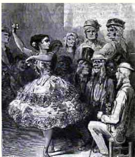
Una academia de baile en Sevilla Gustave Doré

La primera vez que fuimos al Teatro Principal había un lleno, es decir, que la sala estaba casi llena, cosa poco corriente en los teatros españoles, que, la mayor parte del tiempo, no son más frecuentados que los de Italia. Las mujeres estaban en mayoría. Mantillas y flores adornaban todas las cabezas y se veían muy pocos sombreros al estilo de París, lo que daba a los palcos un pintoresco aspecto. El ruido de las conversaciones se mezclaba con el de los abanicos. Notamos a nuestro lado, entre las espectadoras, dos jóvenes sevillanas de abundante cabellera negra, adornada con una gran dalia blanca colocada junto a la oreja. Tras ellas se sentaba su madre. Por su tupida mantilla negra, que encuadraba un semblante arrugado, habría podido tomarse por una vieja dueña de comedia. Al lado de ella se encontraba un inglés de espesas patillas rojas, tocado con un sombrero redondo de ala estrecha y que tenía un bastón en su mano y en la otra unos gemelos que usaba con mucha frecuencia. Nuestro vecino, que había