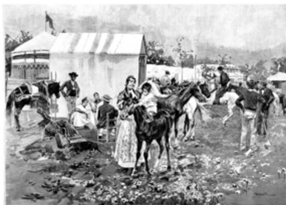
Un rincón de la feria. Rico

A través de calles largas y empinadas, cojeando u tropezando sobre el adoquinado en mal estado, fuimos atravesando entre muchos visitantes de la feria la desordenada ciudadela que, con sus placitas y torrecillas bajo la luz de la luna, ofrecía un aspecto pintoresco. Por fin llegamos a la plaza donde se habían montado las carpas y tenduchos de todo tipo. Parecía tratarse de un gran y alargado salón de baile, cuyo techo estaba formado de cientos de pequeños y grandes farolillos, aunque en realidad estaba al aire libre; se podían ver los árboles y sentir la tierra bajo los pies, u la luz de la luna y as estrellas brillaban aquí y allá entre