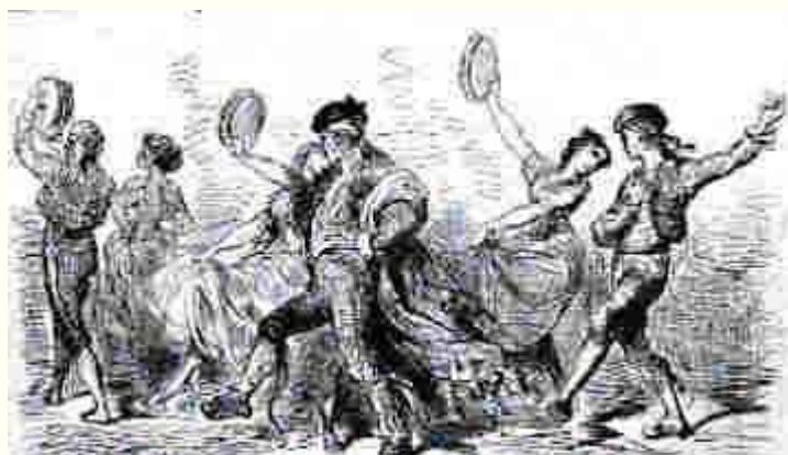
Majos y majas volviendo de la feria del Rocío (alrededores de Sevilla). G. Doré

Los andaluces son indolentes y superficiales, aficionados al baile y al cante y a las diversiones sensuales. Viven bajo el sol más espléndido y el cielo más benigno de Europa y su país es de natural rico y fértil, a pesar de lo cual no hay provincia en España donde haya más mendicidad y miseria, puesto que la mayor parte de la tierra está sin cultivar y no produce más que espinos y maleza, lo que no deja de ser un símbolo sorprendente del estado moral de sus habitantes.