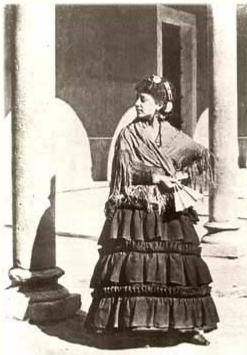
Cigarrera. J. Laurent (1865)

Nos llevaron a los talleres donde se enrollan los cigarro puros. Quinientas o seiscientas mujeres están empleadas en esta preparación. Cuando pusimos el pie en su sala, nos vimos asaltados por un huracán de ruidos: todas aquellas mujeres hablaban, cantaban y discutían todas a la vez. Jamás había oído un alboroto semejante. La mayoría eran jóvenes: y había algunas muy guapas. La sencillez extrema de su ropa y el poco cuidado con que la llevaban puesta permitía apreciar sus encantos con plena libertad. Algunas tenían con toda decisión en el ángulo de la boca un cabo de cigarro puro con el mismo aplomo que lo podría tener un oficial de húsares; otras, ¡oh musa, ven a ayudarme!, otras mascaban el tabaco lo mismo que los viejos lobos de mar. Y es que se les permite coger todo el tabaco que puedan consumir en su puesto de trabajo. Ganan de cuatro a seis reales al día. La cigarrera de Sevilla es un tipo, como lo es el de la manola de Madrid. Hay que verla, el domingo o los días de corridas de toros, con su basquiña con unos inmensos volantes como flecos, sus mangas con botones de azabache, y el puro cuyo humo aspira, y que pasa de vez en cuando a su galán.