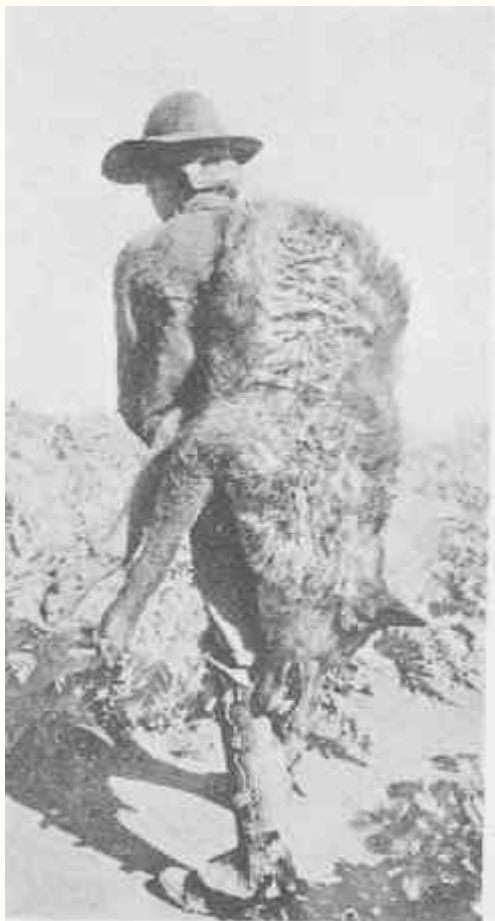
LOBO CAZADO EN SIERRA MORENA. Marzo, 1909. Peso. 93 libras

Estos animales, que hacen un daño increíble a la caza, son muy abundantes en Sierra Morena,