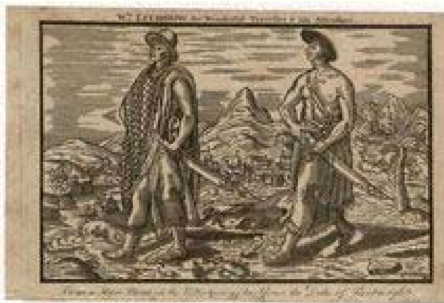
William Lithgow, the Wonderful Traveller and his Attendant . National Portrait Gallery, Londres

Este escocés debe incluirse en la nómina de los grandes viajeros de todos los tiempos. No viajó por el mundo con una misión concreta; simplemente lo hizo por el placer de conocer gentes y tierras diversas. A lo largo de nueve años recorrió unos sesenta mil kilómetros. En 1620, encontrándose en Málaga, fue encarcelado por sospechoso de espiar para la armada inglesa, y más tarde pasó a manos de la Inquisición, acusado de hereje. En total, pasó seis meses en las cárceles de la ciudad, relatando posteriormente en un libro su viaje por España y las crueles torturas a las que fue sometido.