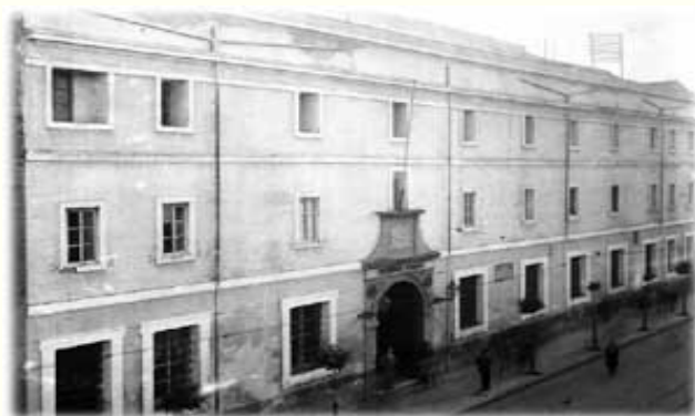
Antigua sede de la Universidad

La Universidad de Sevilla resulta únicamente apropiada para la educación de los clérigos. El curso de estudios dura hasta cinco años dedicados principalmente a los conocimientos de la lengua latina, los estudios de las leyes civiles, la filosofía de Aristóteles y la divinidad escolástica. Apenas se ha introducido algunas mejoras en los últimos cuatro años. La filosofía de Bacon, Locke o Newton resulta completamente desconocida tanto para los profesores como para los alumnos. La guerra ha disminuido considerablemente el número de estudiantes, ya que una buena cantidad se ha incorporado al ejército. Ellos no residen dentro de la universidad, pero tienen alojamientos privados en diferentes lugares de la ciudad.