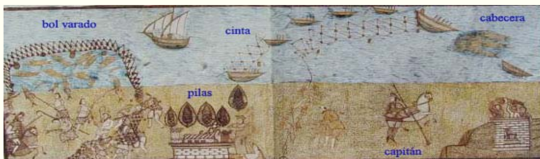
Las almadrabas. S. XIII al XIX. Fundación Casa de Medina Sidonia

Tras la expulsión de los jesuitas (1767), Pedro Rodríguez de Campomanes, a la sazón fiscal del Consejo Real, le propuso recorrer Andalucía para hacer inventario y descripción del patrimonio pictórico de los colegios de los jesuitas. Pero el abate no se limitó a ello sino que fue recopilando, además de noticias relativas a monumentos artísticos de todo tipo, otras relativas a usos y costumbres, recursos o población de las localidades. Espoleado por las descripciones de algunos viajeros europeos que fomentaban la difusión de la Leyenda Negra, Ponz aspiraba a disponer de una base de datos sobre la realidad de la España de su tiempo que permitiera emitir juicios de valor fundamentados. Para ello decidió hacer una guía destinada a viajeros en la cual, además de describir cuidadosamente el patrimonio artístico, se ofreciesen informaciones fidedignas y correctas para subsanar las carencias y corregir los errores impresos por los extranjeros.