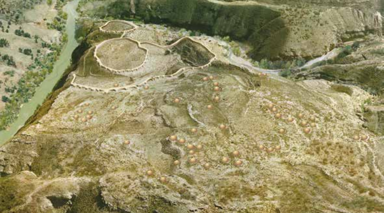
Reconstrucción sobre fotografía aérea de la necrópolis de Los Millares