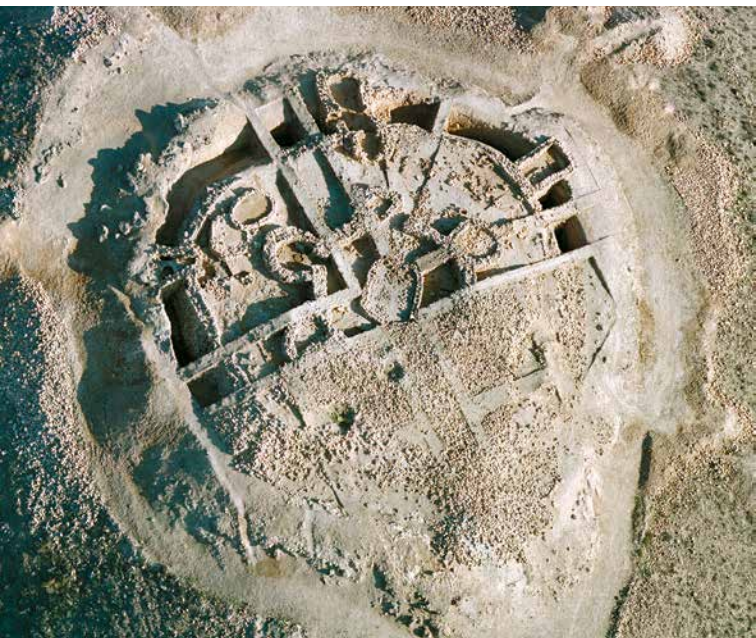
Vista aérea del Fortín 1 en 1985

El sistema defensivo de Los Millares se completa con 13 fortines que se localizan en las colinas más prominentes a ambos lados de la rambla de Huéchar. Su composición va desde torres circulares de planta simple con una pequeña barbacana que defiende la puerta, hasta estructuras mucho más complejas, como la del Fortín 1, al que, aparte de la función estratégica y militar, se le han atribuido otras funciones como la actividad de molienda y almacenaje del cereal, la de aprendizaje, ya que aquí se iniciaba a los jóvenes en la talla de puntas de flecha, y la actividad ritual o simbólica, sugerida por los numerosos ídolos antropomorfos en hueso y piedra encontrados.