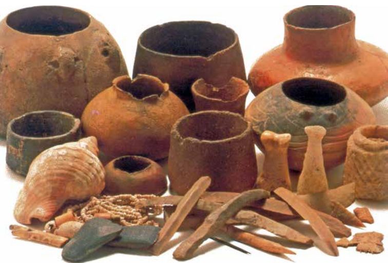
Ajuar funerario de la tumba 40 (Museo Arqueológico Nacional)

El status de los individuos enterrados queda reflejado en los ajuares funerarios, es decir, en aquellos objetos con los que se enterraban. Destacan los objetos fabricados con materias primas exóticas como el marfil o la cáscara de huevo de avestruz, útiles de cobre, vasijas de cerámica con decoración simbólica o campaniforme y puntas de flecha y puñales de sílex.