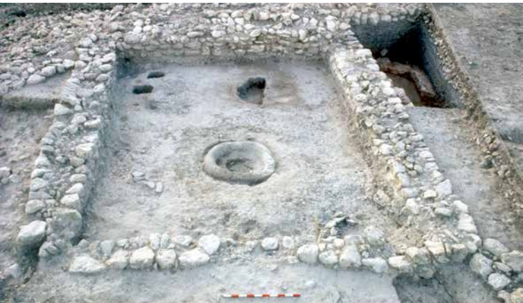
El taller metalúrgico CE 72

Cierra el área más interna de la meseta central que se ha considerado como el recinto más singular por los edificios de uso comunal que se han documentado en su interior. Destacan los de planta rectangular relacionados con el trabajo metalúrgico,