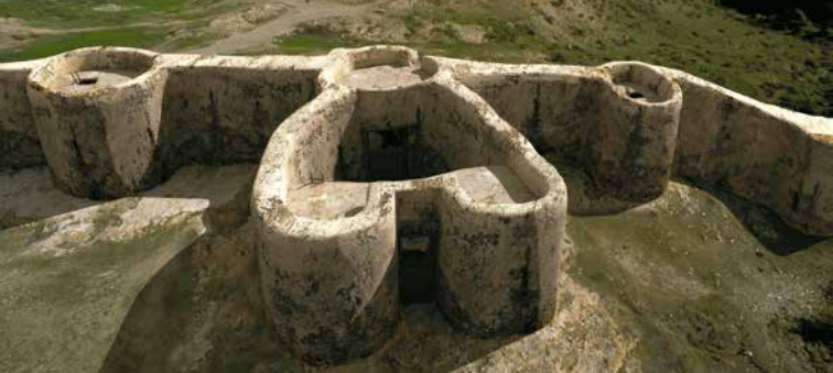
Reconstrucción infográfica de la puerta principal

También aquí encontramos dos tumbas, anteriores a la edificación de este recinto, que quedaron incluidas dentro del perímetro de la muralla tras su construcción.