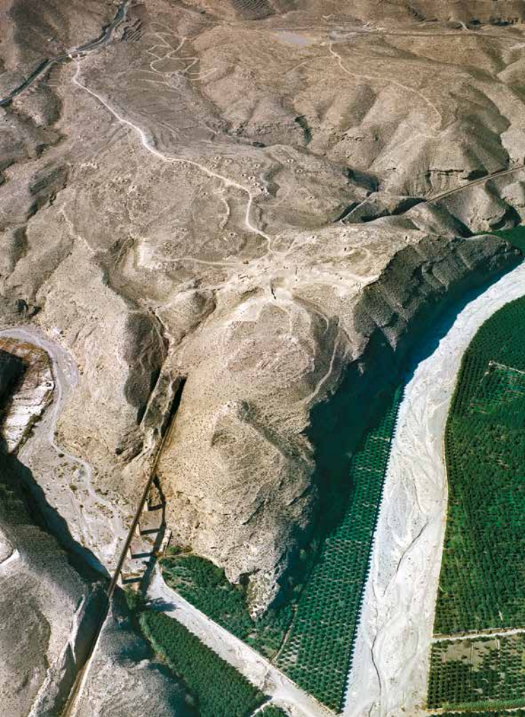
Vista aérea del Llano de Los Millares entre la rambla de Huéchar y el río Andarax

El Enclave Arqueológico de Los Millares se localiza en el municipio de Santa Fe de Mondújar (Almería), en una meseta con forma de espolón entre la Rambla de Huéchar y el río Andarax, a 20 km de su desembocadura.