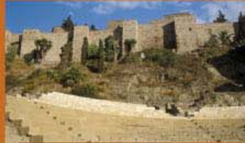
VISTA DEL TEATRO Y ALCAZABA

La ciudad romana, especialmente en sus fases posteriores a la conquista o integración en el Estado romano, debió mantener su fisonomía urbana de tradición oriental y su cultura como demuestran las excavaciones arqueológicas con el hallazgo en la ladera de inscripciones púnicas, realizadas sobre cerámicas de importación romana, y monedas emitidas en la ciudad en época romana pero aún con escritura e iconografía púnica.