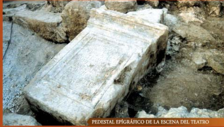
PEDESTAL EPÍGRAFICO DE LA ESCENA DEL TEATRO

En estos momentos, en el teatro se llevan a cabo simultáneamente tareas de excavación, de restauración y consolidación. Los trabajos arqueológicos se realizan en las partes central y norte de la escena, en la zona alta de la cavea y en los espacios de la ladera.