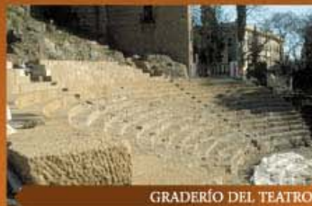
GRADERÍO DEL TEATRO

En la ladera norte de esta colina ha sido localizado uno de los cementerios de la ciudad fenicia cuando se realizaban las obras del nuevo túnel, hecho que permitió conocer algunas tumbas, construidas con sillares, y restos de ricos adornos personales de los allí enterrados, como magníficos pendientes de oro.