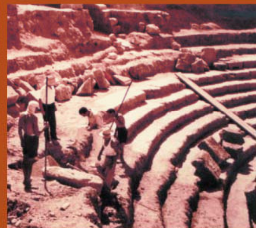
EXCAVACIONES EN EL TEATRO DURANTE LOS AÑOS 50 Y 60