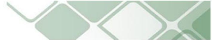
Informes emitidos. Año 2012