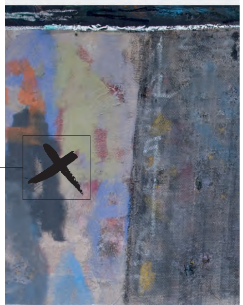
Attilio Manzì (detalle)