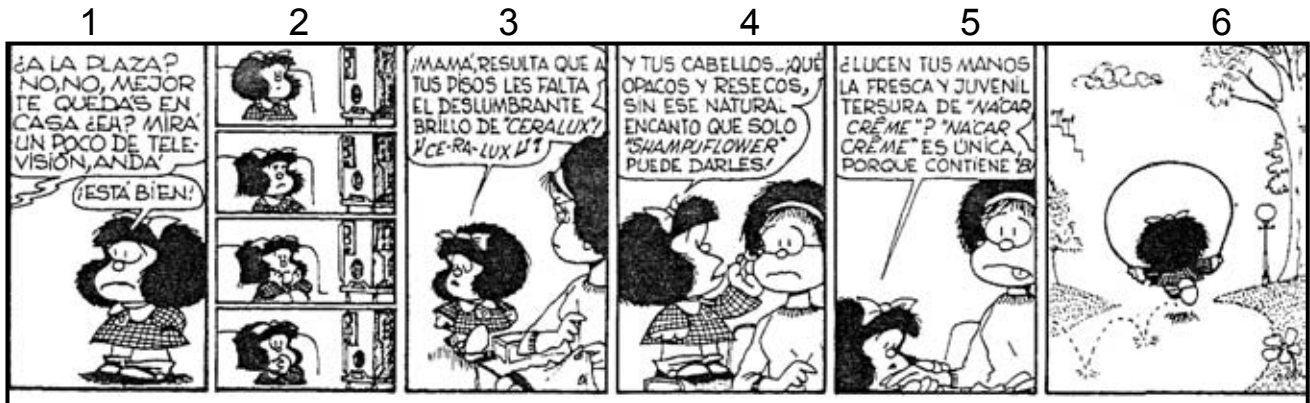
Quino: Todo Mafalda . Ed. Lumen