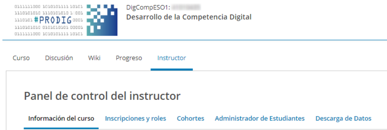
Imagen Panel de control del instructor

Toda la información que se va a tratar se encuentra en el enlace Instructor del curso, el cual da acceso al Panel de control del Instructor, como se muestra en la imagen.