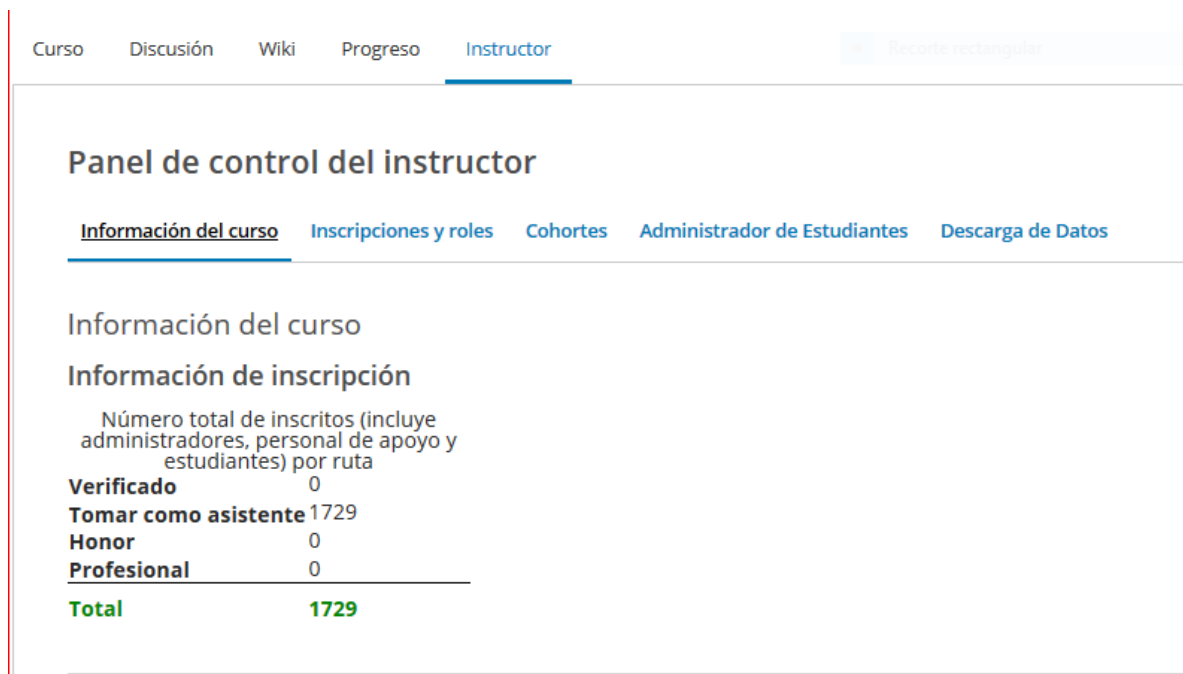
Imagen del Panel de control del Instructor- Información del curso

El número que nos ofrece corresponde a todas las personas inscritas en el curso.